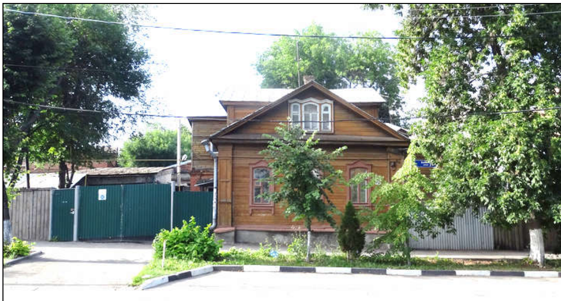
Объект культурного наследия (ул. Бебеля, 18). Вид на главный (северный) фасад с противоположной стороны ул. Бебеля. Современное фото.