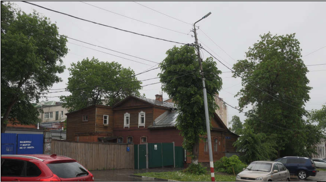
Объект культурного наследия (ул. Бебеля, 18). Общий вид с ул. Бебеля в направлении с востока на запад. Современное фото.