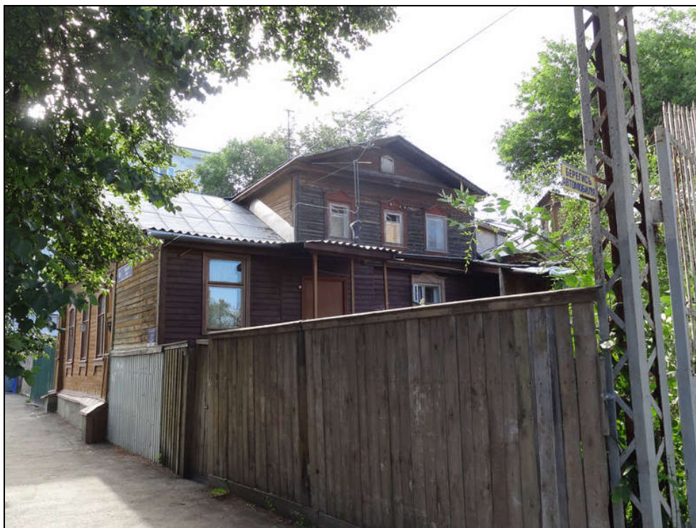
Объект культурного наследия (ул. Бебеля, 18). Вид с ул. Бебеля в направлении с запада на восток. Современное фото.