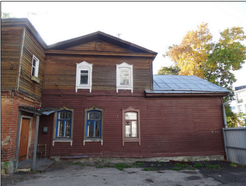
Объект культурного наследия (ул. Бебеля, 18). Вид с дворовой территории на боковой (восточный) фасад. Современное фото.