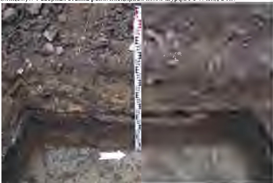
Рис. 9. Объект «Земельный участок общей площадью 1188 кв. м с кадастровым номером 73:24.041403:37 по адресу: г. Ульяновск, ул. Карла Маркса (рядом с городским кладбищем)». Восточная стенка рекогносцировочного шурфа № 1. Вид с З.