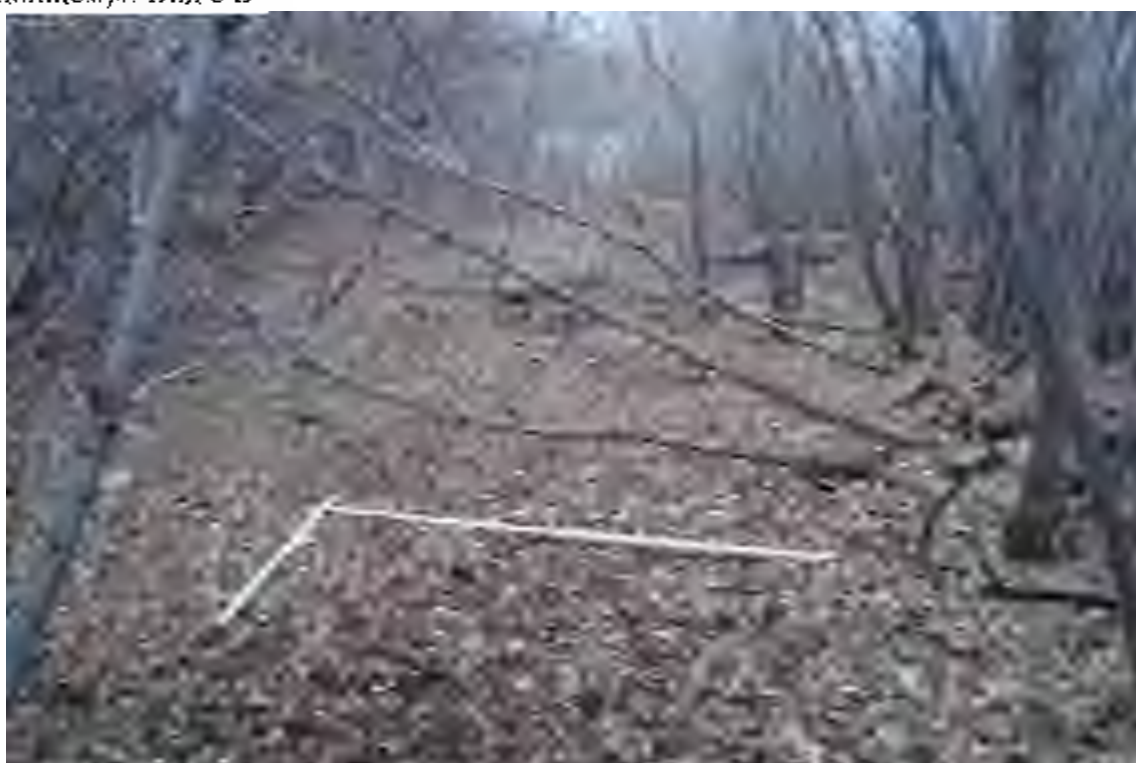
Рис. 7. Объект «Земельный участок общей площадью 1188 кв. м с кадастровым номером 73:24.041403:37 по адресу: г. Ульяновск, ул. Карла Маркса (рядом с городским кладбищем)». Место закладки рекогносцировочного шурфа № 1. Вид с З.