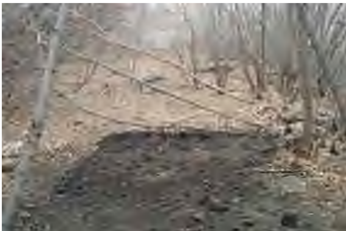
Рис. 12. Объект «Земельный участок общей площадью 1188 кв. м. с кадастровым номером 73:24.041403:37 по адресу: г. Ульяновск, ул. Карла Маркса (рядом с городским кладбищем)». Рекультивация рекогносцировочного шурфа № 1. Вид с Ю.