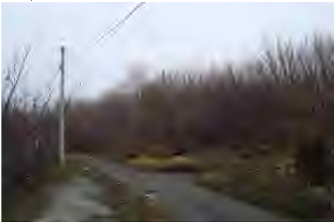
Рис. 5. Объект «Земельный участок общей площадью 1188 кв. м с кадастровым номером 73:24.041403:37 по адресу: г. Ульяновск, ул. Карла Маркса (рядом с городским кладбищем)». Вид с ЮВ.