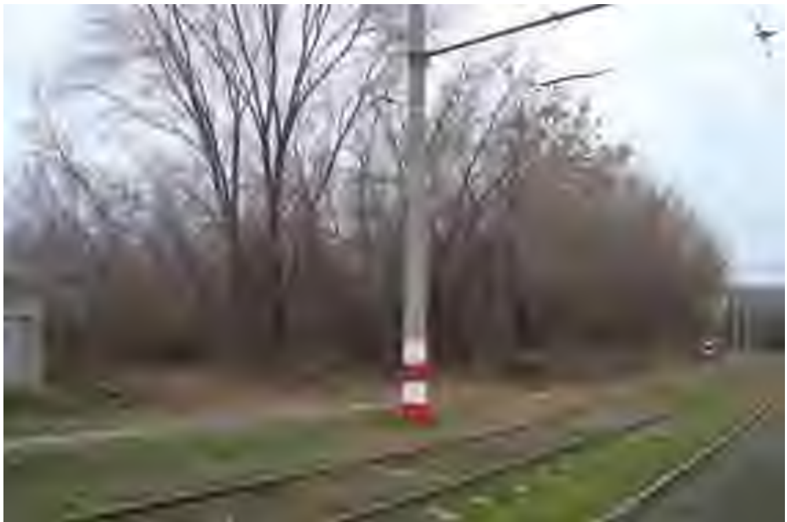
Рис. 4. Объект «Земельный участок общей площадью 1188 кв. м с кадастровым номером 73:24.041403:37 по адресу: г. Ульяновск, ул. Карла Маркса (рядом с городским кладбищем)». Вид с СВ.