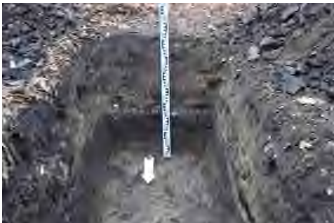
Рис. 10. Объект «Земельный участок общей площадью 1188 кв. м. с кадастровым номером 73:24.041403:37 по адресу. г. Ульяновск, ул. Карла Маркса (рядом с городским кладбищем)». Южная стенка рекогносцировочного шурфа № 1. Вид с С.