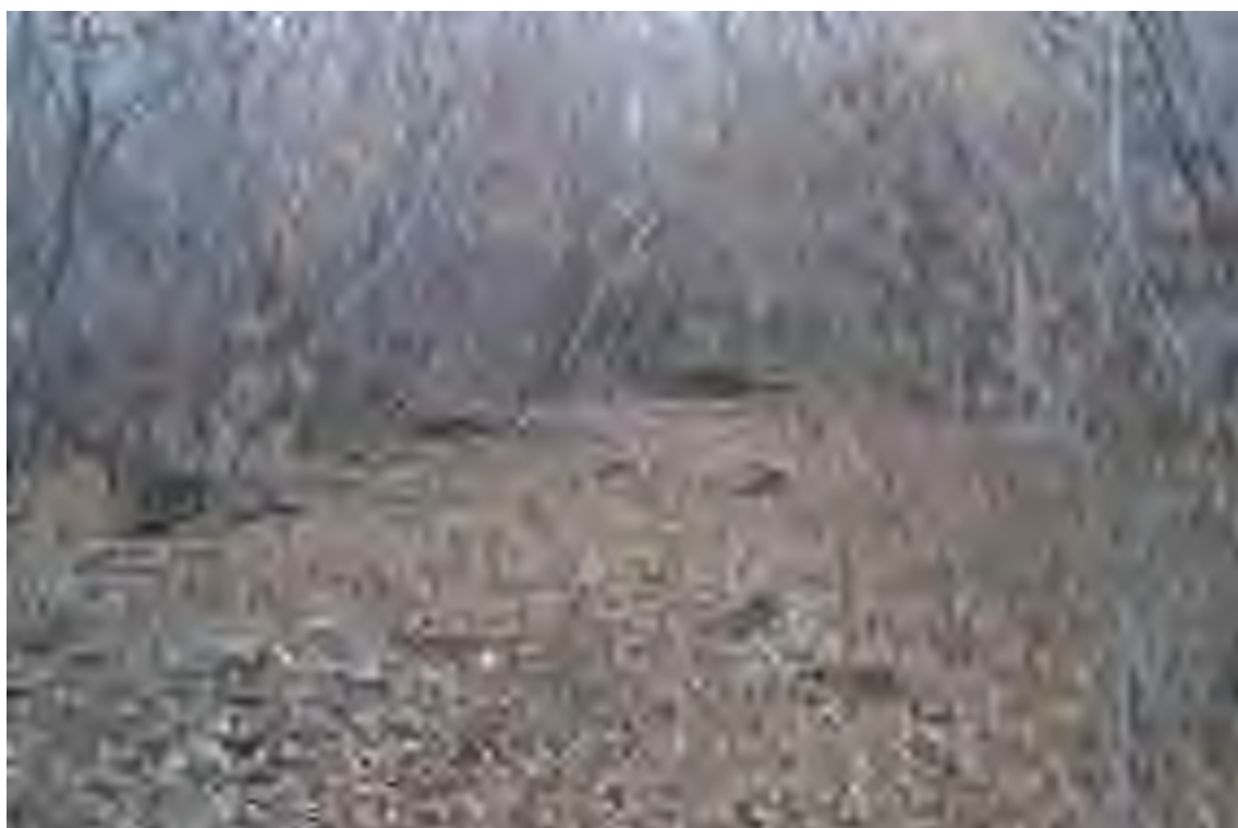
Рис. 6. Объект «Земельный участок общей площадью 1188 кв. м с кадастровым номером 73:24.041403:37 по адресу: г. Ульяновск, ул. Карла Маркса (рядом с городским кладбищем)». Вид с В