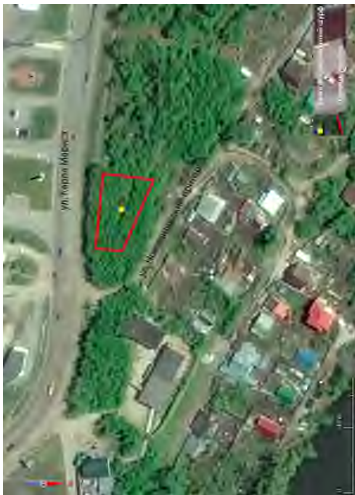
Рис. 3 Объект «Земельный участок общей площадью 1188 кв. м с кадастровым номером 73:24.041403:37 по адресу: г. Ульяновск, ул. Карла Маркса (рядом с городским кладбищем)». Схема отводного земельного участка с рекогносцировочным шурфом.