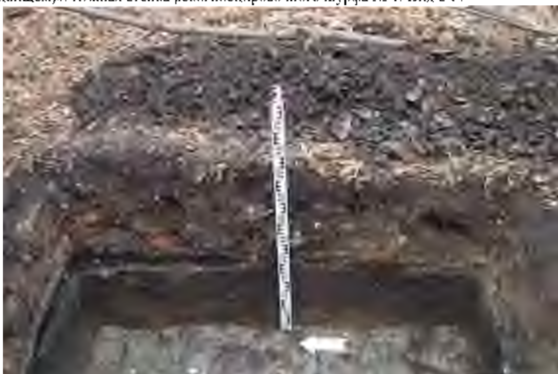
Рис. 11. Объект «Земельный участок общей площадью 1188 кв. м. с кадастровым номером 73:24.041403:37 по адресу. г. Ульяновск, ул. Карла Маркса (рядом с городским кладбищем)». Западная стенка рекогносцировочного шурфа № 1. Вид с В.