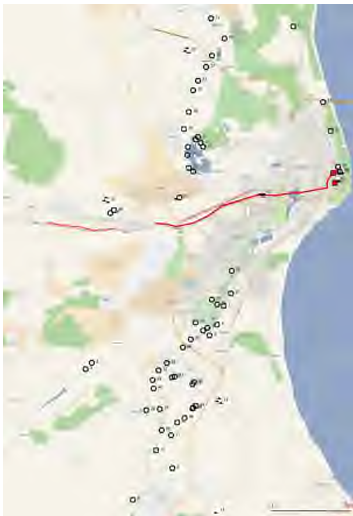
Рис. 2. Объект «Земельный участок общей площадью 1188 кв. м. с кадастровым номером 73:24:041403:37 по адресу: г. Ульяновск, ул. Карла Маркса (рядом с городским