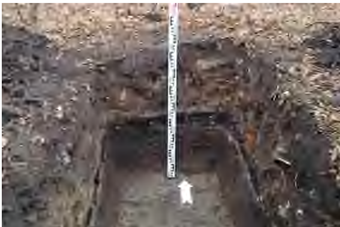
Рис. 8. Объект «Земельный участок общей площадью 1188 кв. м с кадастровым номером 73:24.041403:37 по адресу: г. Ульяновск, ул. Карла Маркса (рядом с городским кладбищем)». Северная стенка рекогносцировочного шурфа № 1. Вид с Ю.