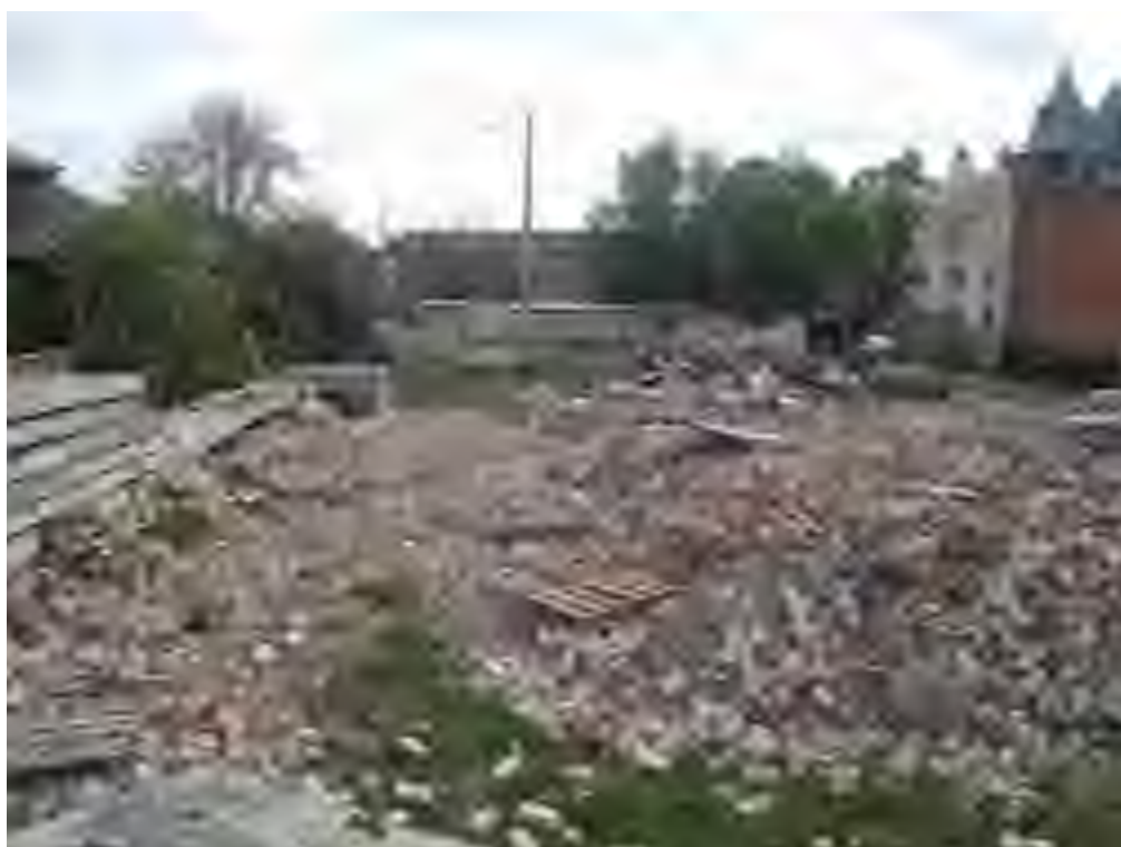
Рис. 8. Объект «Земельный участок общей площадью 2332 кв. м. с кадастровым номером 73:24:041604:1018 по адресу: г. Ульяновск, ул. Радищева, 91а». Вид с З.