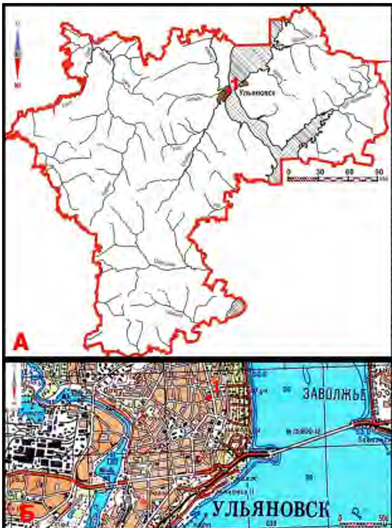
Рис. 1. Объект «Земельный участок общей площадью 2332 кв. м. с кадастровым номером 73:24/041604/1018 по адресу: г. Ульяновск, ул. Радищева, 91а»: