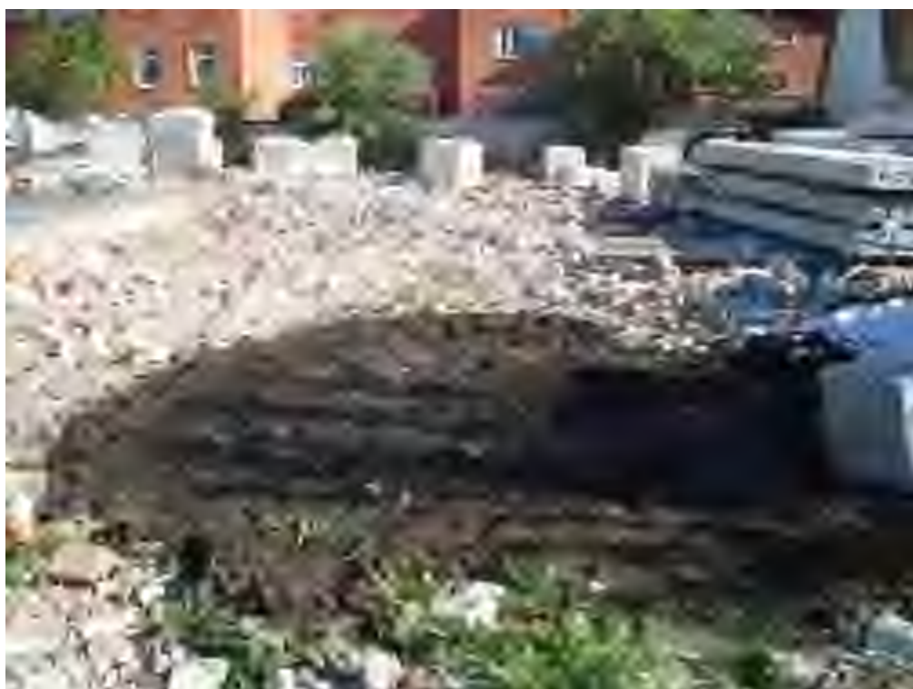
Рис. 14. Объект «Земельный участок общей площадью 2332 кв. м. с кадастровым номером 73:24.041604:1018 по адресу г. Ульяновск, ул. Радищева, 91а». Рекультивация рекогносцировочного шурфа № 1. Вид с С.