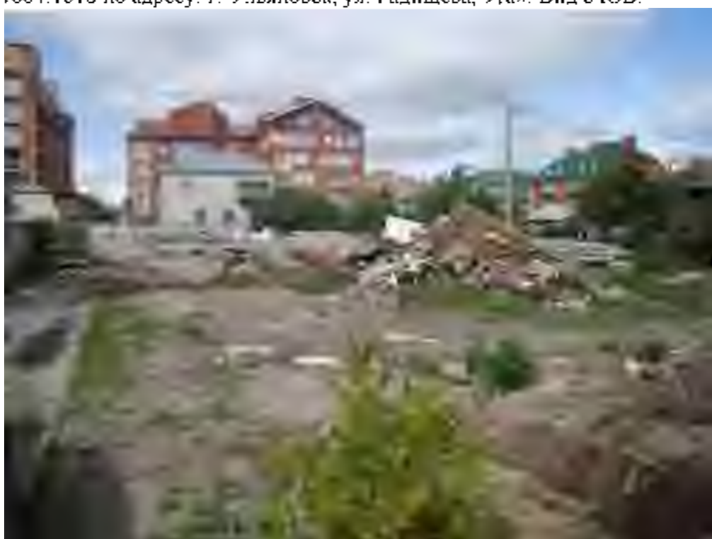
Рис. 5. Объект «Земельный участок общей площадью 2332 кв. м. с кадастровым номером 73:24:041604:1018 по адресу: г. Ульяновск, ул. Радищева, 91а». Вид с В.