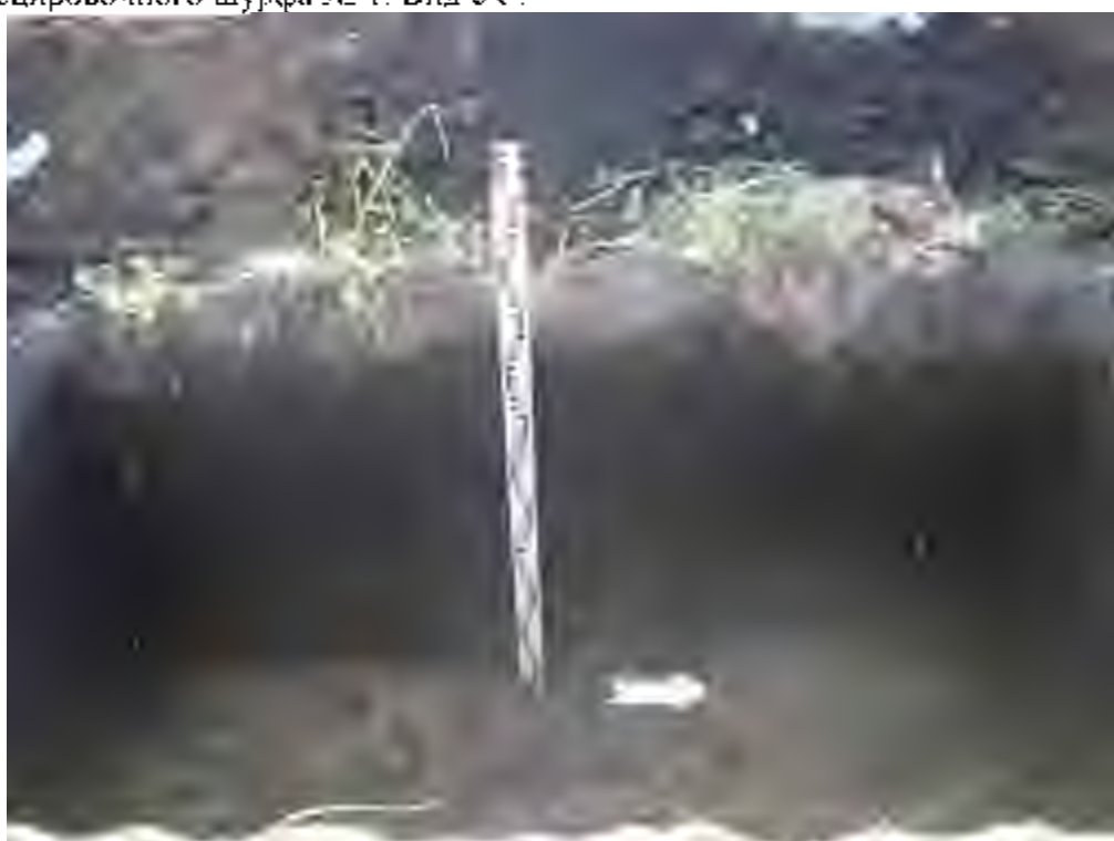
Рис. 13. Объект «Земельный участок общей площадью 2332 кв. м. с кадастровым номером 73:24:041604:1018 по адресу: г. Ульяновск, ул. Радищева, 91а». Западная стенка рекогносцировочного шурфа № 1. Вид с В.