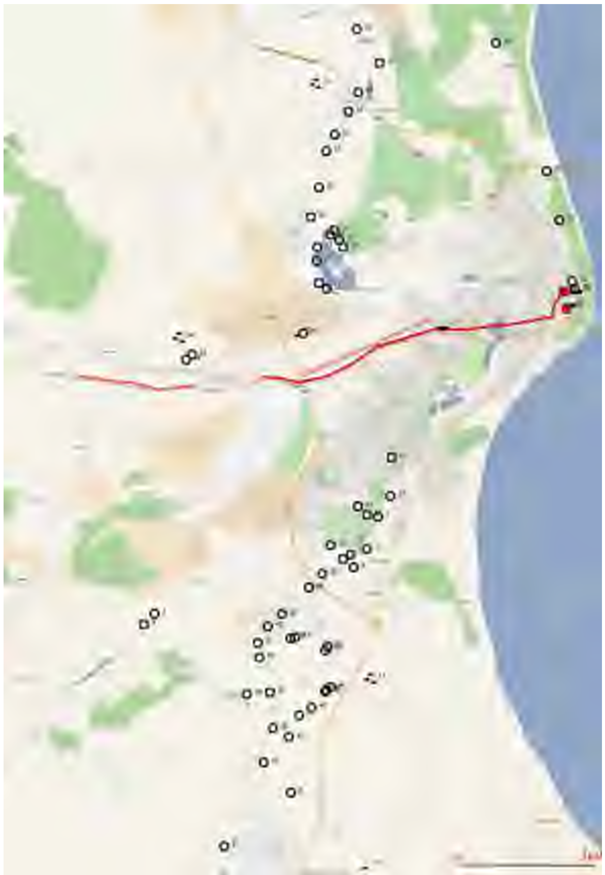
Рис. 2. Объект «Земельный участок общей площадью 2332 кв. м. с кадастровым номером 73:24:041604:1018 по адресу: г. Ульяновск, ул. Радищева, 91а». Карта-схема расположения известных памятников археологии на территории г. Ульяновск.