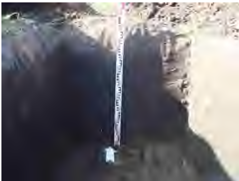
Рис. 10. Объект «Земельный участок общей площадью 2332 кв. м. с кадастровым номером 73:24:041604:1018 по адресу: г. Ульяновск, ул. Радищева, 91а». Северная стенка рекогносцировочного шурфа № 1. Вид с Ю.