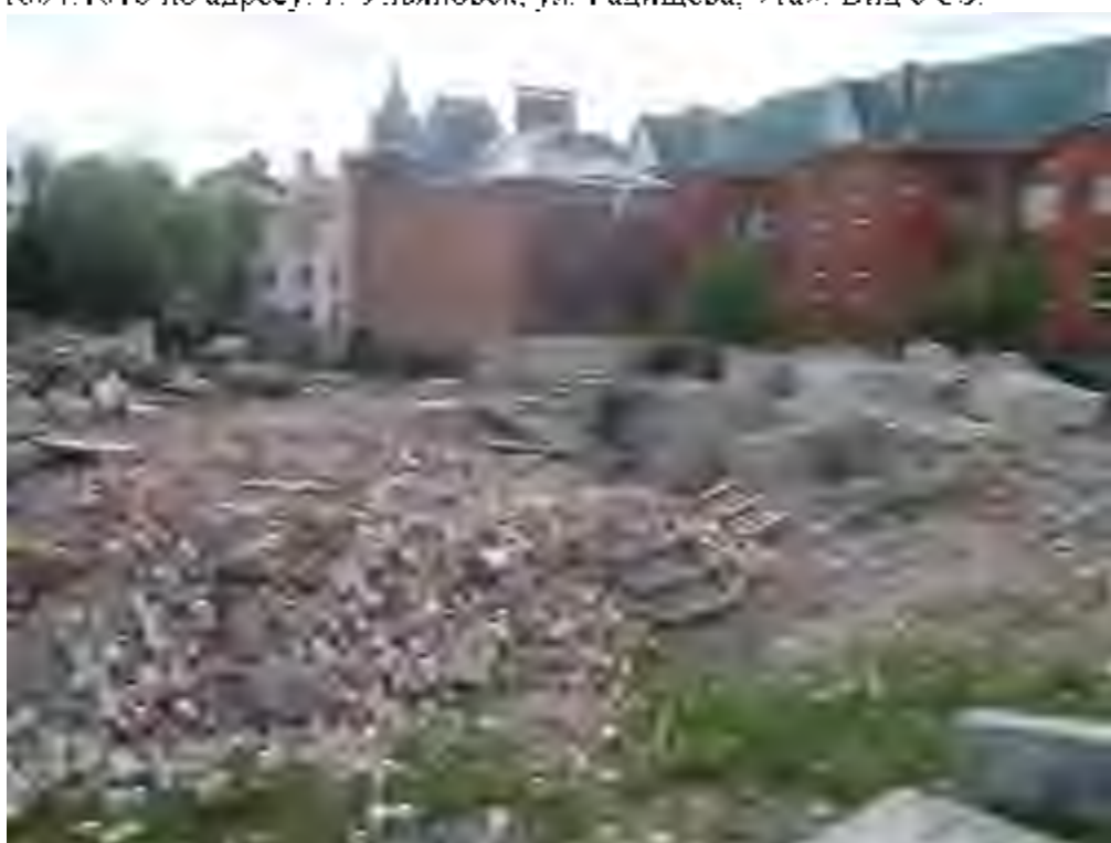
Рис. 7. Объект «Земельный участок общей площадью 2332 кв. м. с кадастровым номером 73:24.041604:1018 по адресу: г. Ульяновск, ул. Радищева, 91а». Вид с З.