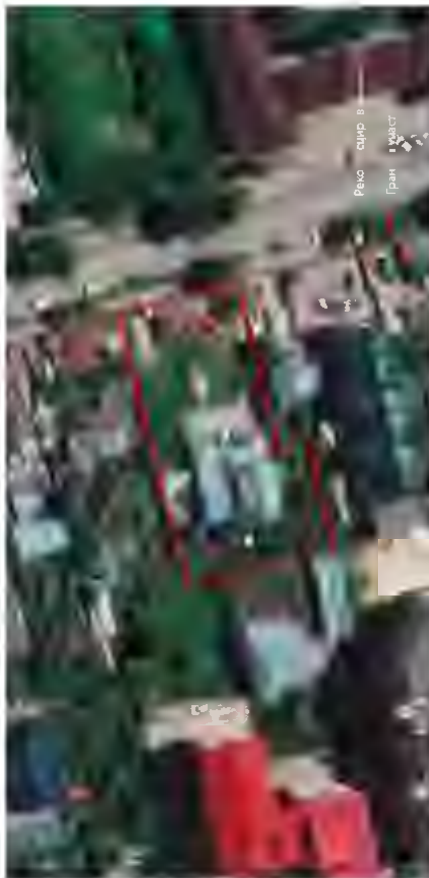
Рис. 3. Объект «Земельный участок общей площадью 2332 кв. м. с кадастровым номером 73:24:041604:1018 по адресу: г. Ульяновск, ул. Радищева, 91а». Схема отводимого земельного участка с рекогносцировочным шурфом