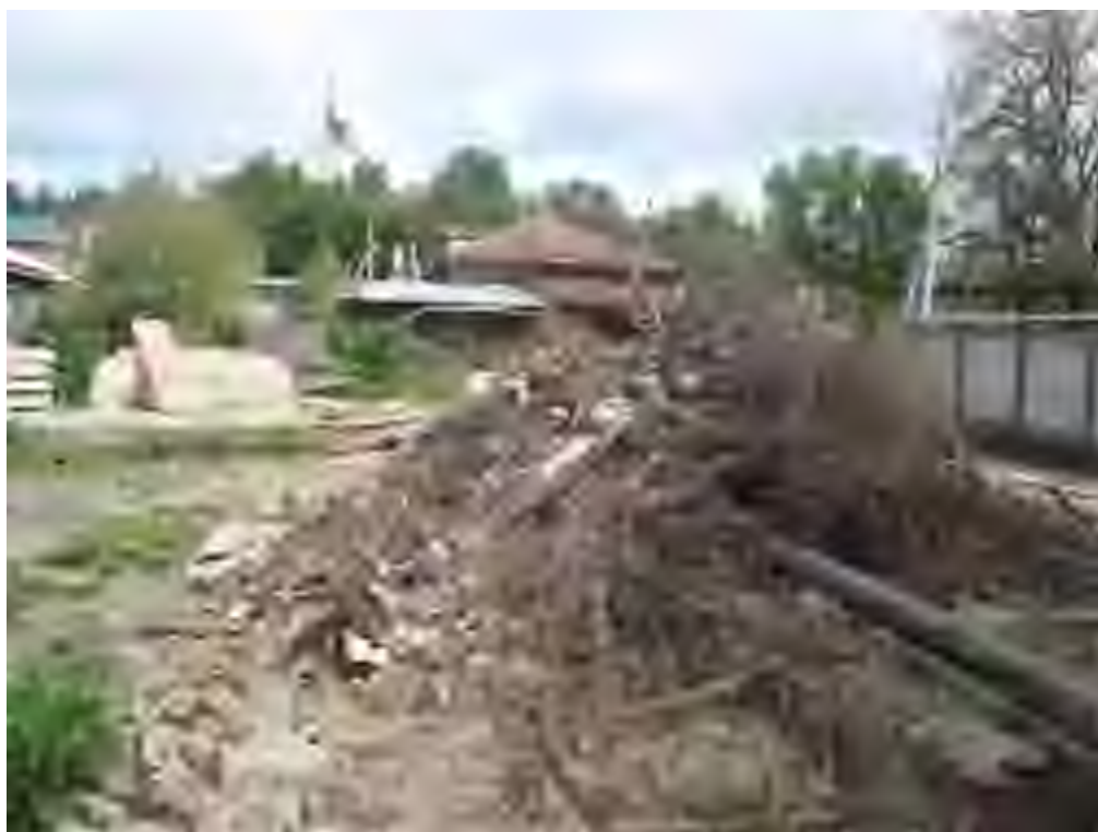
Рис. 4. Объект «Земельный участок общей площадью 2332 кв. м. с кадастровым номером 73:24:041604:1018 по адресу: г. Ульяновск, ул. Радищева, 91а». Вид с ЮВ.