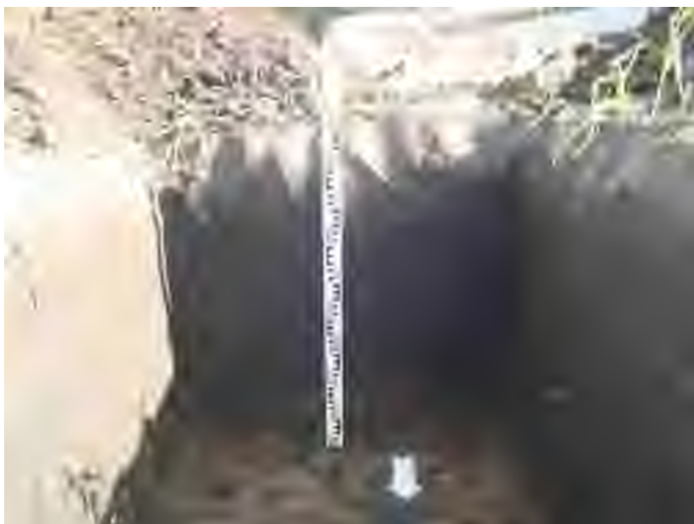
Рис. 12. Объект «Земельный участок общей площадью 2332 кв. м. с кадастровым номером 73:24:041604:1018 по адресу: г. Ульяновск, ул. Радищева, 91а». Южная стенка рекогносцировочного шурфа № 1. Вид с С.