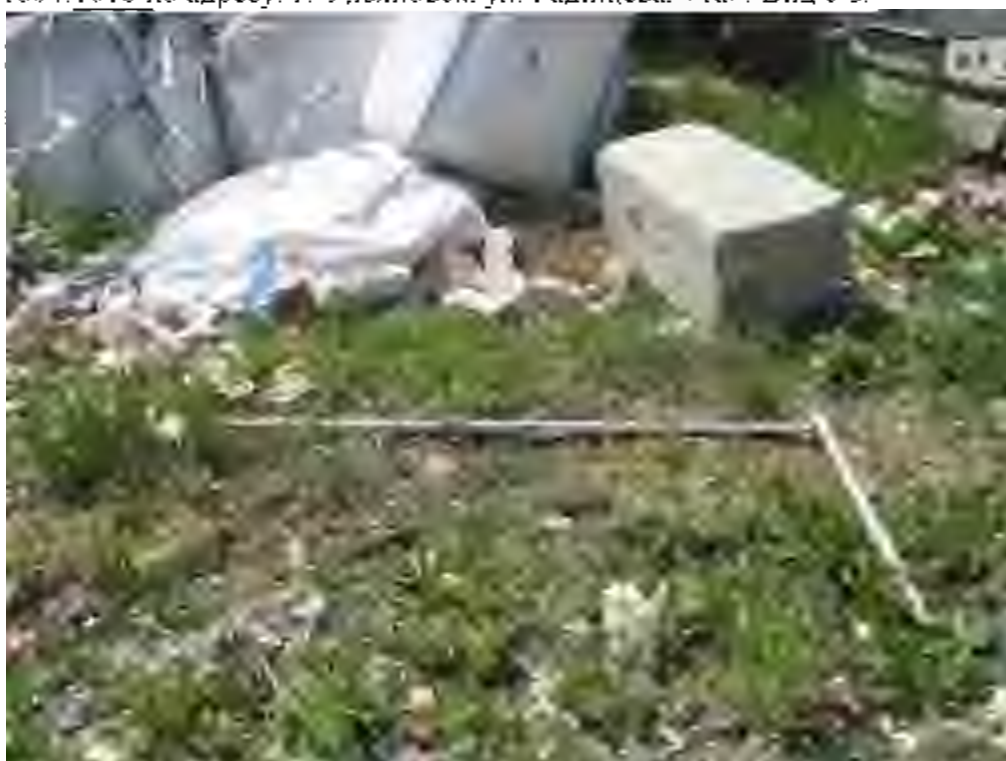
Рис. 9. Объект «Земельный участок общей площадью 2332 кв. м. с кадастровым номером 73:24:041604:1018 по адресу: г. Ульяновск, ул. Радищева, 91а». Место закладки рекогносцировочного шурфа № 1. Вид с В.