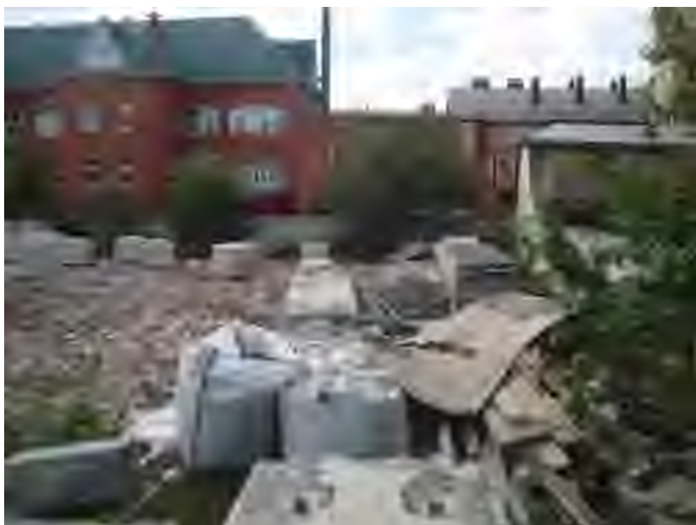
Рис. 6. Объект «Земельный участок общей площадью 2332 кв. м. с кадастровым номером 73:24.041604:1018 по адресу: г. Ульяновск, ул. Радищева, 91а». Вид с СЗ.