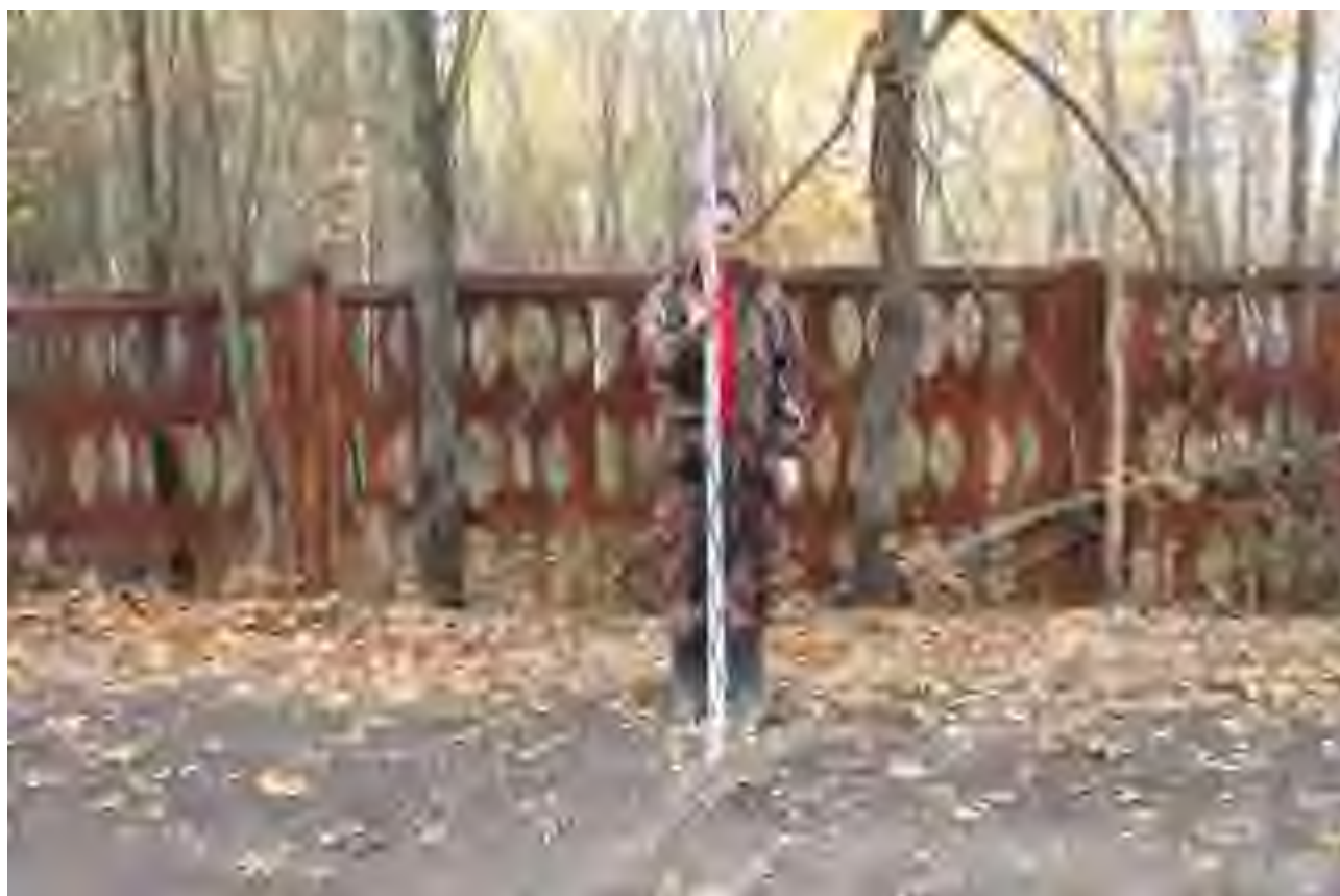
Илл. 35. Археологические разведки на земельных участках, отведенных под расположение объекта: « Инв. № 15591-2018 "Реконструкция Детского оздоровительного лагеря "Чайка" (бизнес код: 001.2013.10002711) Николаевский район Ульяновской области. Точка фотофиксации №9. Вид с Ю.