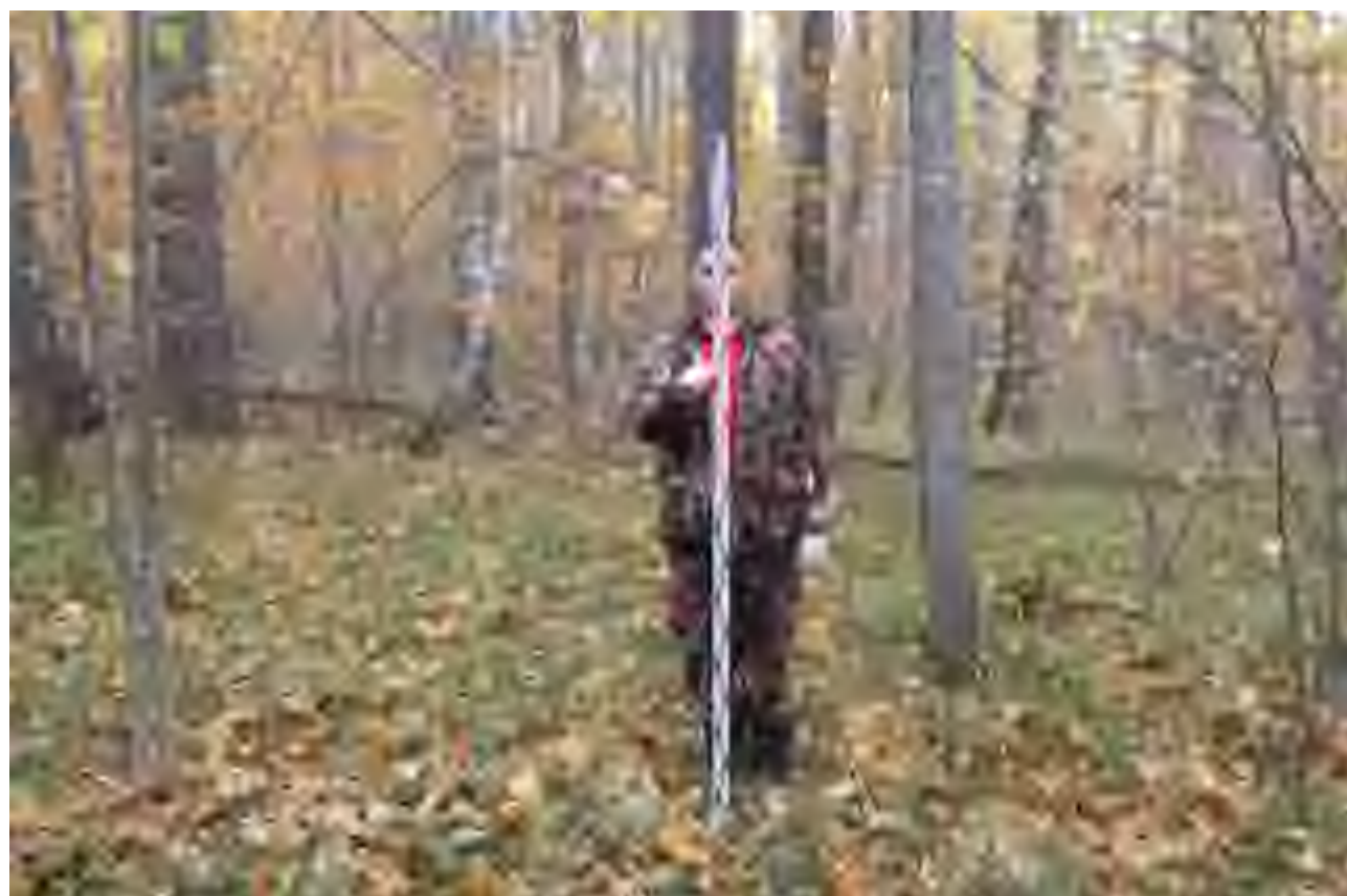
Илл. 13. Археологические разведки на земельных участках, отведенных под расположение объекта: « Инв. № 15591-2018 "Реконструкция Детского оздоровительного лагеря "Чайка" (бизнес код: 001.2013.10002711) Николаевский район Ульяновской области. Точка фотофиксации №3. Вид с Ю.