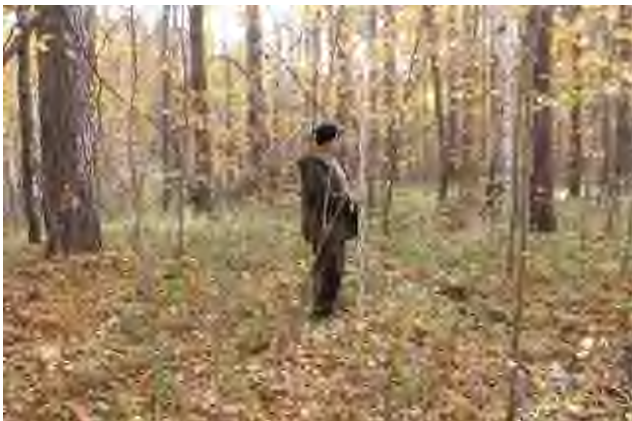
Илл. 19. Археологические разведки на земельных участках, отведенных под размещение объекта: « Инв. № 15591-2018 "Реконструкция Детского оздоровительного лагеря "Чайка" (бизнес код: 001.2013.10002711) Николаевский район Ульяновской области. Точка фотофиксации №4. Вид с С.