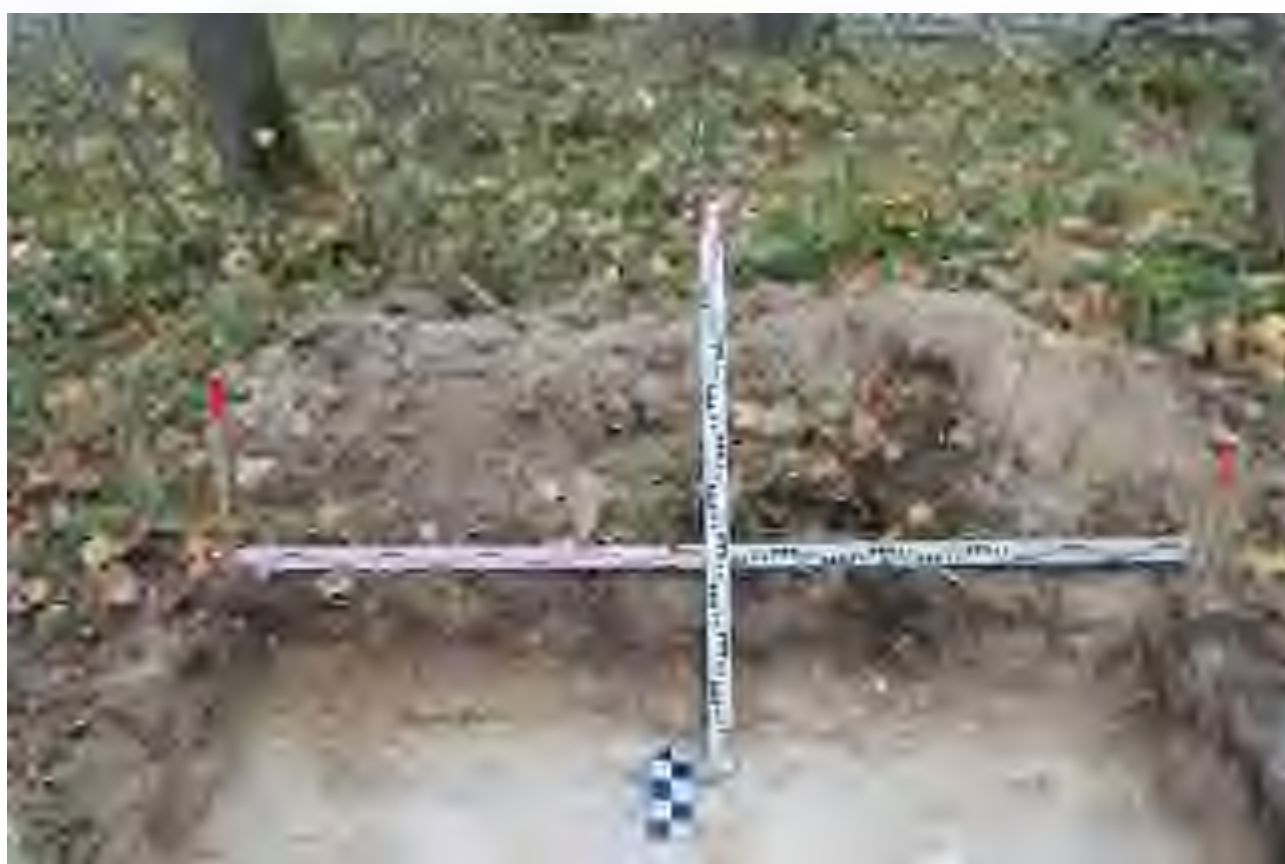
Илл. 44. Археологические разведки на земельных участках, отведенных под размещение объекта: « Ипв. № 15591-2018 "Реконструкция Детского оздоровительного лагеря "Чайка" (бизнес код: 001.2013.10002711) Николаевский район Ульяновской области. Материк Шурф №1. Вид с Ю