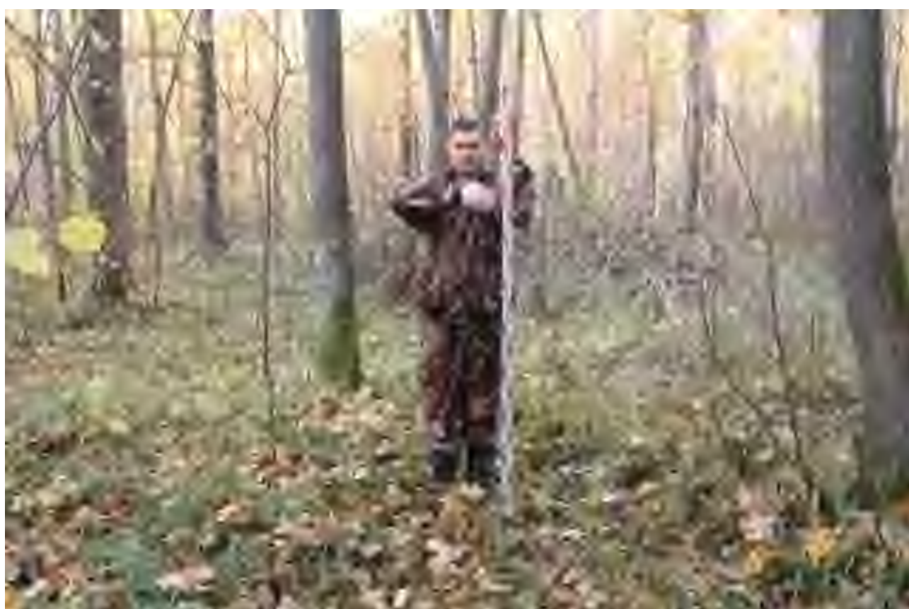
Илл. 8. Археологические разведки на земельных участках, отведенных под размещение объекта, « Ипв. № 15591-2018 "Реконструкция Детского оздоровительного лагеря "Чайка" (бизнес код: 001.2013.10002711) Николаевский район Ульяновской области. Точка фотофиксации №1. Вид с В.