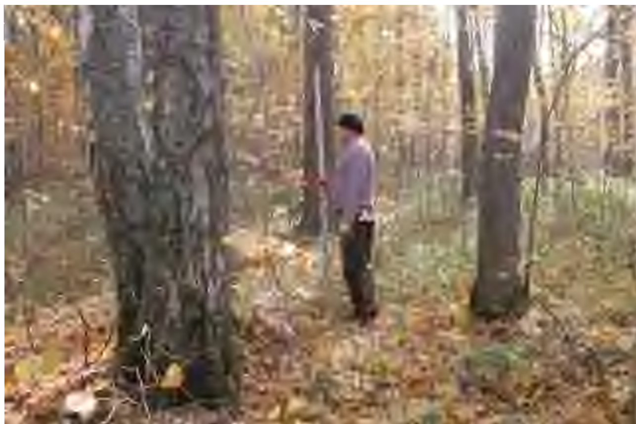
Илл. 23. Археологические разведки на земельных участках, отведенных под размещение объекта: « Ипг. № 15591-2018 "Реконструкция Детского оздоровительного лагеря "Чайка" (бизнес код: 001.2013.10002711) Николаевский район Ульяновской области. Точка фотофиксации №5. Вид с С.