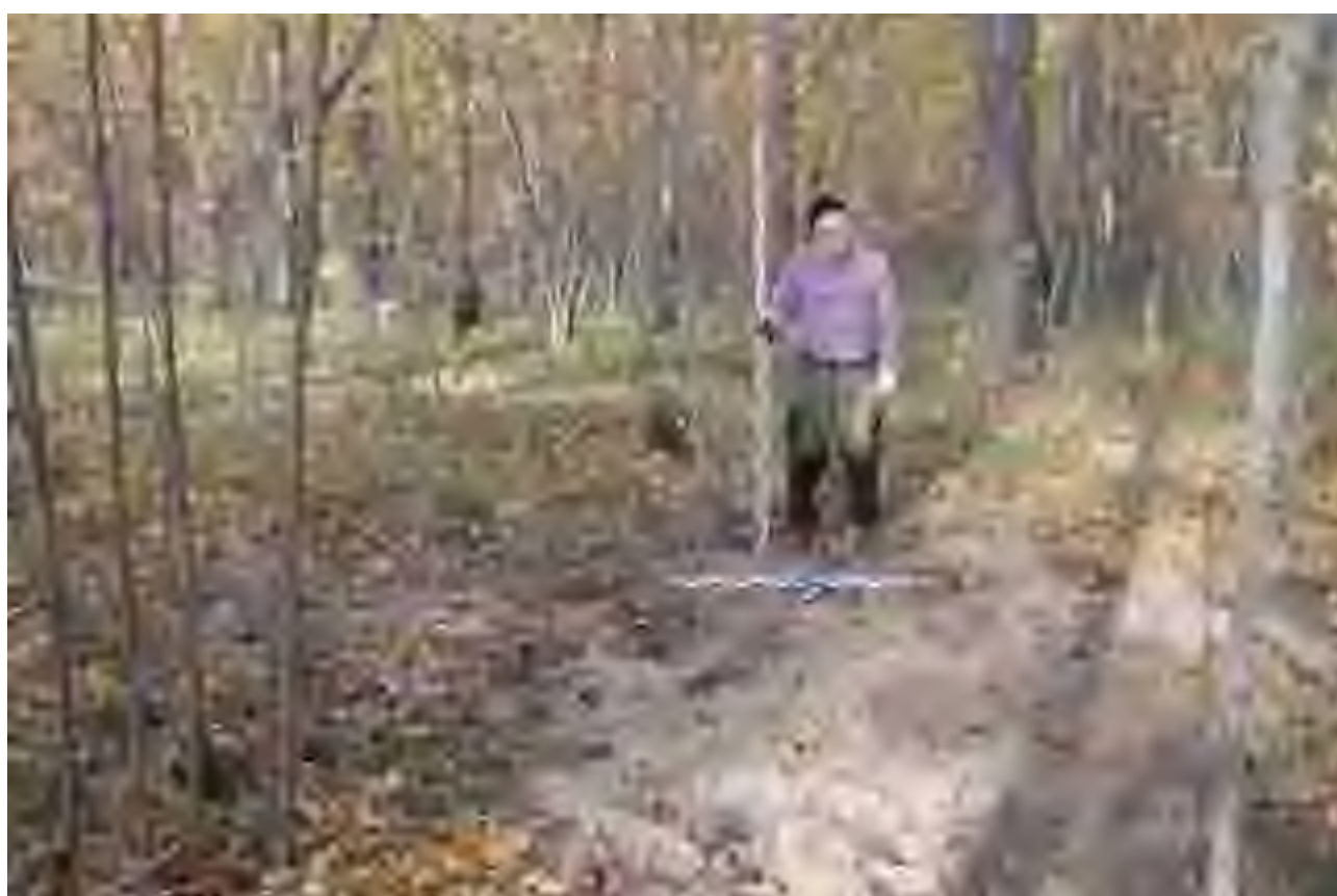
Илл. 58. Археологические разведки на земельных участках, отведенных под размещение объекта: « Итв. № 15591-2018 "Реконструкция Детского оздоровительного лагеря "Чайка" (бизнес код: 001.2013.10002711) Николаевский район Ульяновской области. Рекультивированный шурф №4. Вид с Ю.