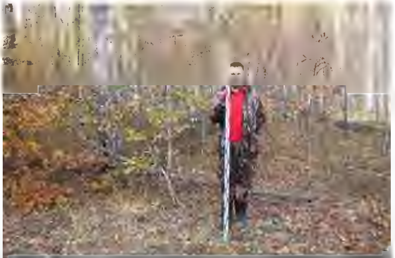
Илл. 31. Археологические разведки на земельных участках, отведенных под размещение объекта: « Инв. № 15591-2018 "Реконструкция Детского оздоровительного лагеря "Чайка" (бизнес код: 001.2013.10002711) Николаевский район Ульяновской области. Точка фотофиксации №8. Вид с С.