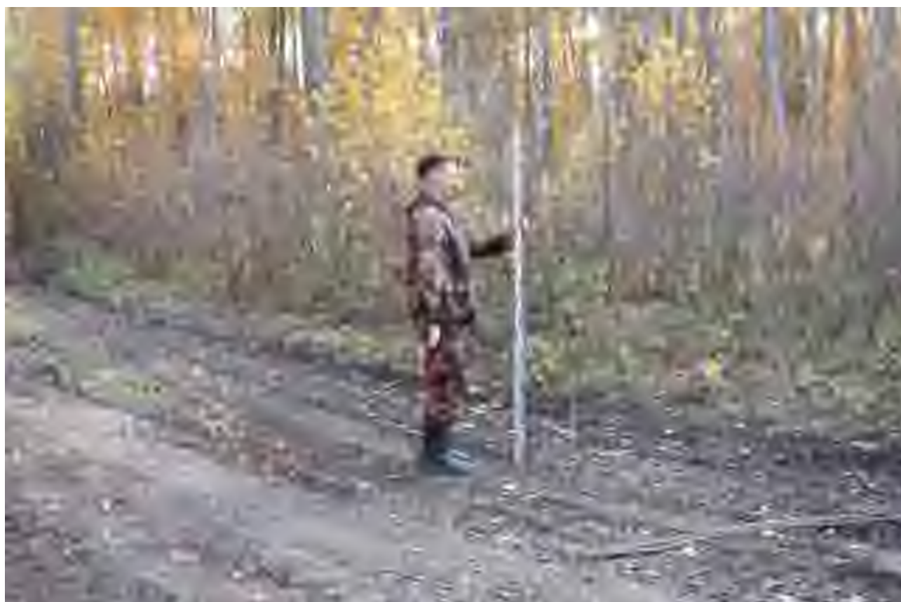
Илл. 33. Археологические разведки на земельных участках, отведенных под размещение объекта: « Инв. № 15591-2018 "Реконструкция Детского оздоровительного лагеря "Чайка" (бизнес код: 001.2013.10002711) Николаевский район Ульяновской области. Точка фотофиксации №8. Вид с С.