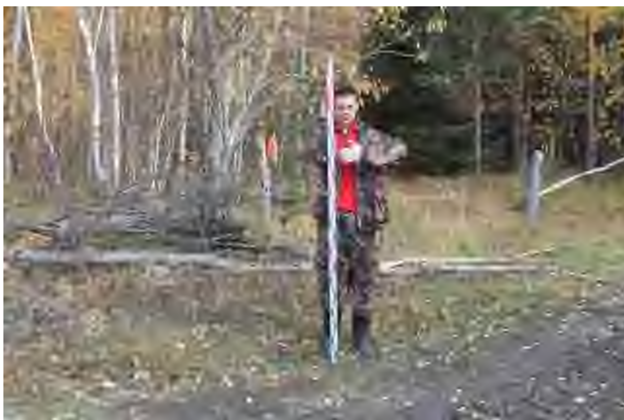
Илл. 34. Археологические разведки на земельных участках, отведенных под размещение объекта: « Инв. № 15591-2018 "Реконструкция Детского оздоровительного лагеря "Чайка" (бизнес код: 001.2013.10002711) Николаевский район Ульяновской области. Точка фотофиксации №8. Вид с З.