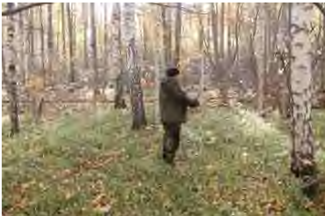
Илл. 11. Археологические разведки на земельных участках, отведенных под размещение объекта: «Ипв. № 15591-2018 "Реконструкция Детского оздоровительного лагеря "Чайка" (бизнес код: 001.2013.10002711) Николаевский район Ульяновской области. Точка фотофиксации №2. Виде С.