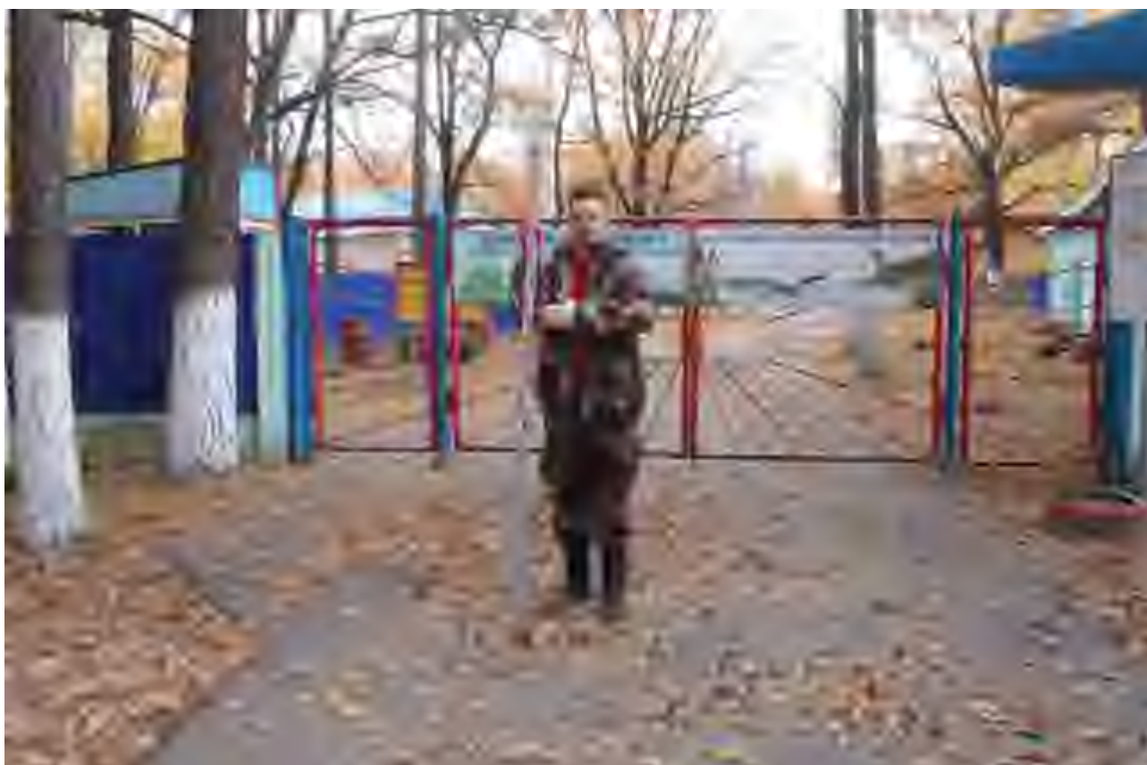
Илл. 41. Археологические разведки на земельных участках, отведенных под расположение объекта: « Инв. № 15591-2018 "Реконструкция Детского оздоровительного лагеря "Чайка" (бизнес код: 001.2013.10002711) Николаевский район Ульяновской области. Точка фотофиксации №10. Виде 3.