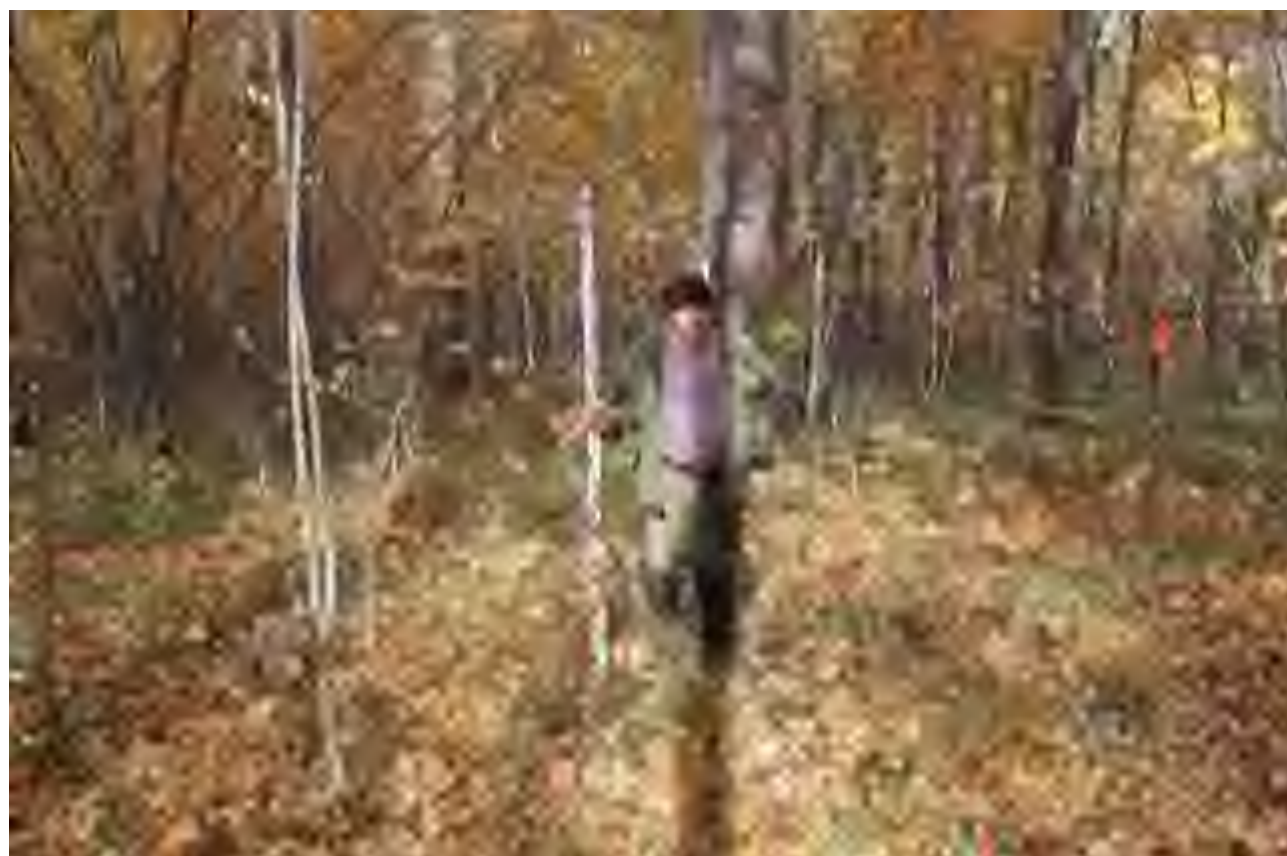
Илл. 17. Археологические разведки на земельных участках, отведенных под расположение объекта: « Инв. № 15591-2018 "Реконструкция Детского оздоровительного лагеря "Чайка" (бизнес код: 001.2013.10002711) Николаевский район Ульяновской области. Точка фотофиксации №4. Вид с Ю.