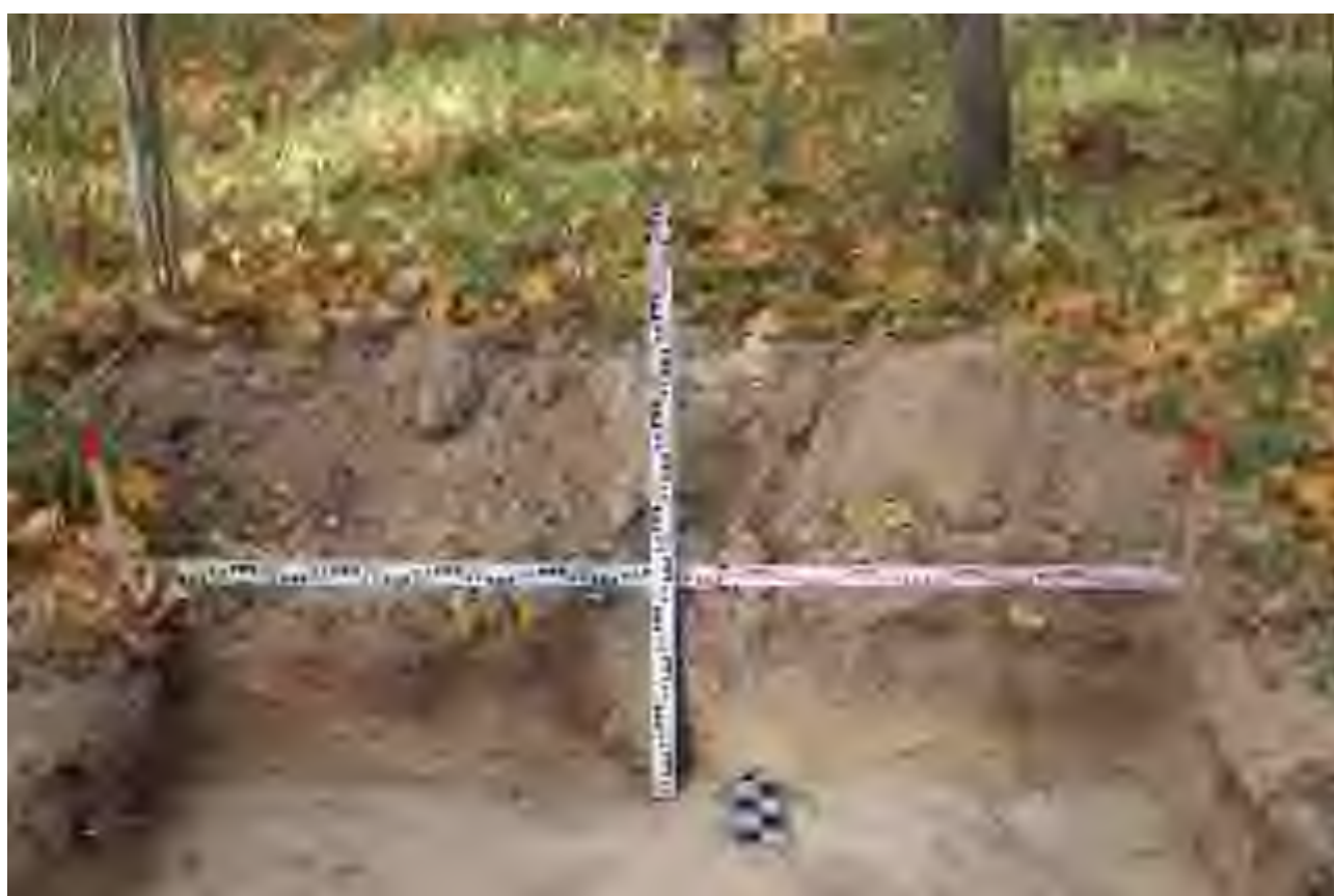
Илл. 52. Археологические разведки на земельных участках, отведенных под размещение объекта: « Ипв. № 15591-2018 "Реконструкция Детского оздоровительного лагеря "Чайка" (бизнес код: 001.2013.10002711) Николаевский район Ульяновской области. Материк. Шурф №2. Вид с Ю.