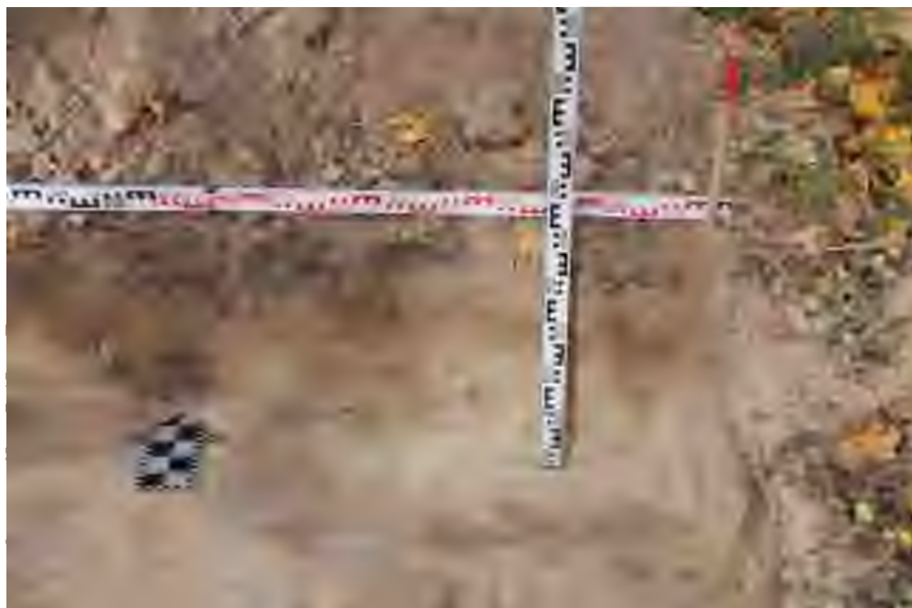
Илл. 53. Археологические разведки на земельных участках, отведенных под размещение объекта: « Итв. № 15591-2018 "Реконструкция Детского оздоровительного лагеря "Чайка" (бизнес код: 001.2013.10002711) Николаевский район Ульяновской области. Контрольный прокоп. Шурф №3. Вид с Ю.