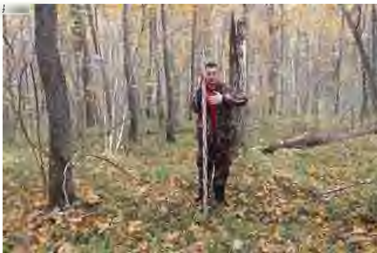
Илл. 14. Археологические разведки на земельных участках, отведенных под расположение объекта: « Инв. № 15591-2018 "Реконструкция Детского оздоровительного лагеря "Чайка" (бизнес код: 001.2013.10002711) Николаевский район Ульяновской области. Точка фотофиксации №3. Вид с З.