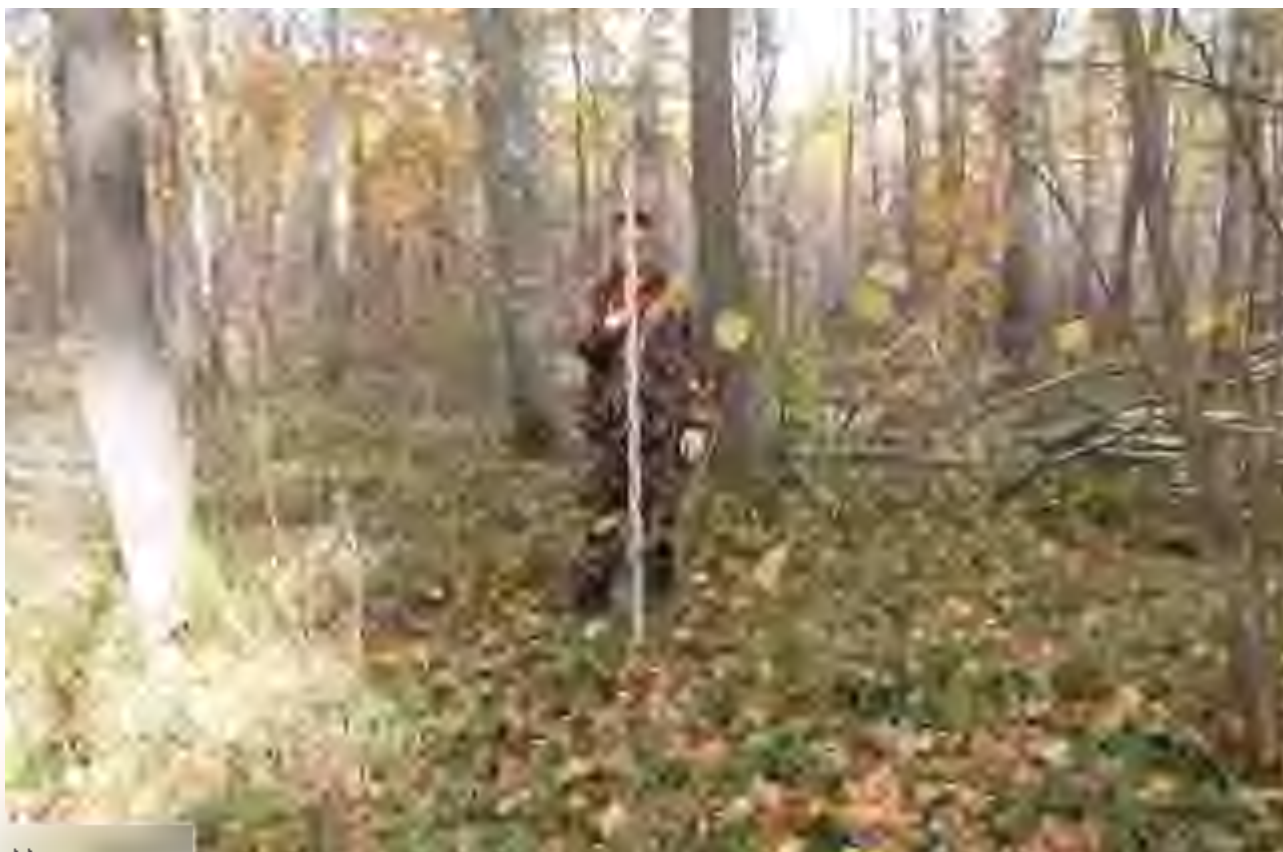
Илл. 5. Археологические разведки на земельных участках, отведенных под размещение объекта: «Ипп. № 15591-2018 "Реконструкция Детского оздоровительного лагеря "Чайка" (бизнес код: 001.2013.10002711) Николаевский район Ульяновской области. Точка фотофиксации №1. Вид с Ю.