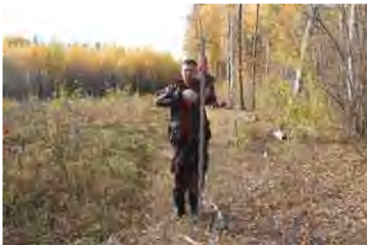
Илл. 30. Археологические разведки на земельных участках, отведенных под расположение объекта: « Инв. № 15591-2018 "Реконструкция Детского оздоровительного лагеря "Чайка" (бизнес код: 001.2013.10002711) Николаевский район Ульяновской области. Точка фотофиксации №7. Вид с В.