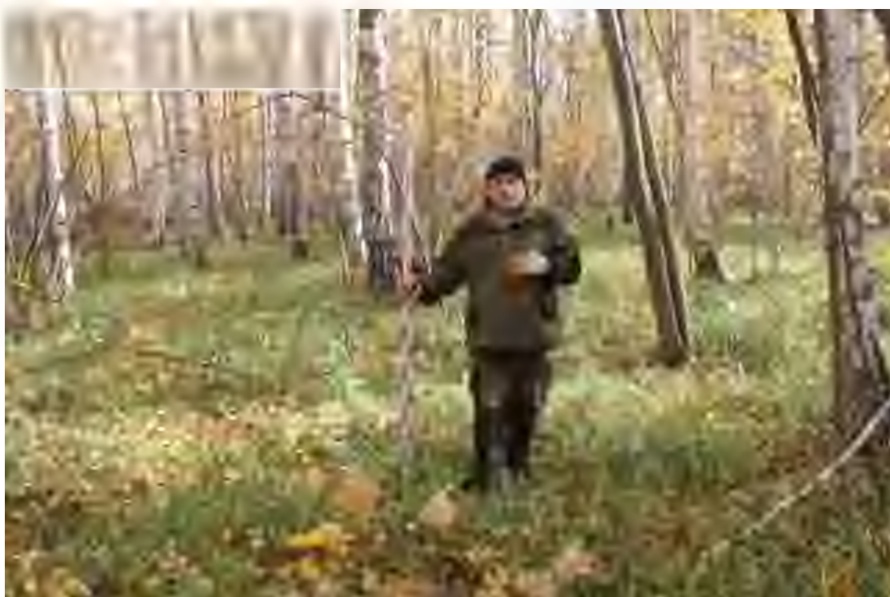
Илл. 12. Археологические разведки на земельных участках, отведенных под размещение объекта: «Ипв. № 15591-2018 "Реконструкция Детского оздоровительного лагеря "Чайка" (бизнес код: 001.2013.10002711) Николаевский район Ульяновской области. Точка фотофиксации №2. Виде З.