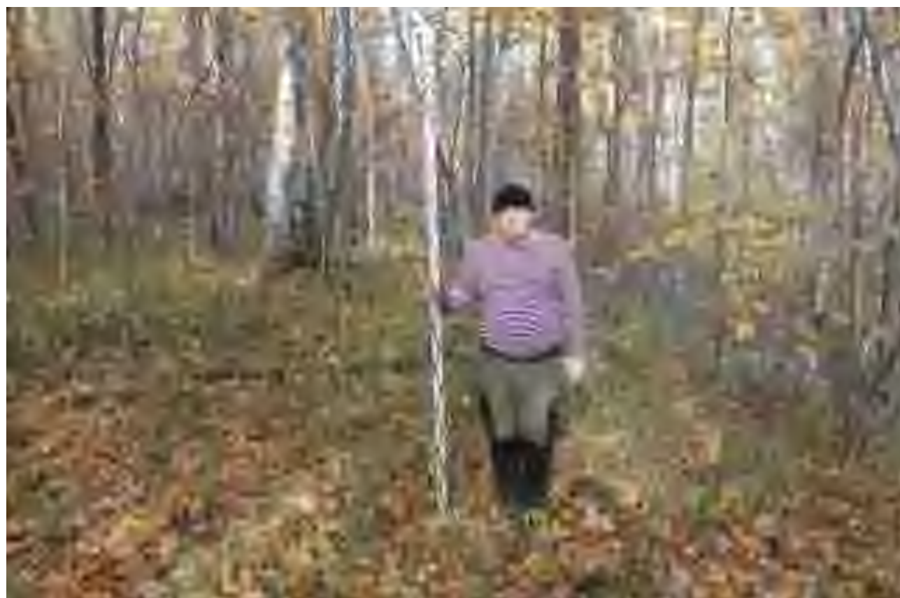
Илл. 25. Археологические разведки на земельных участках, отведенных под расположение объекта: « Инв. № 15591-2018 "Реконструкция Детского оздоровительного лагеря "Чайка" (бизнес код: 001.2013.10002711) Николаевский район Ульяновской области. Точка фотофиксации №6. Вид с Ю.