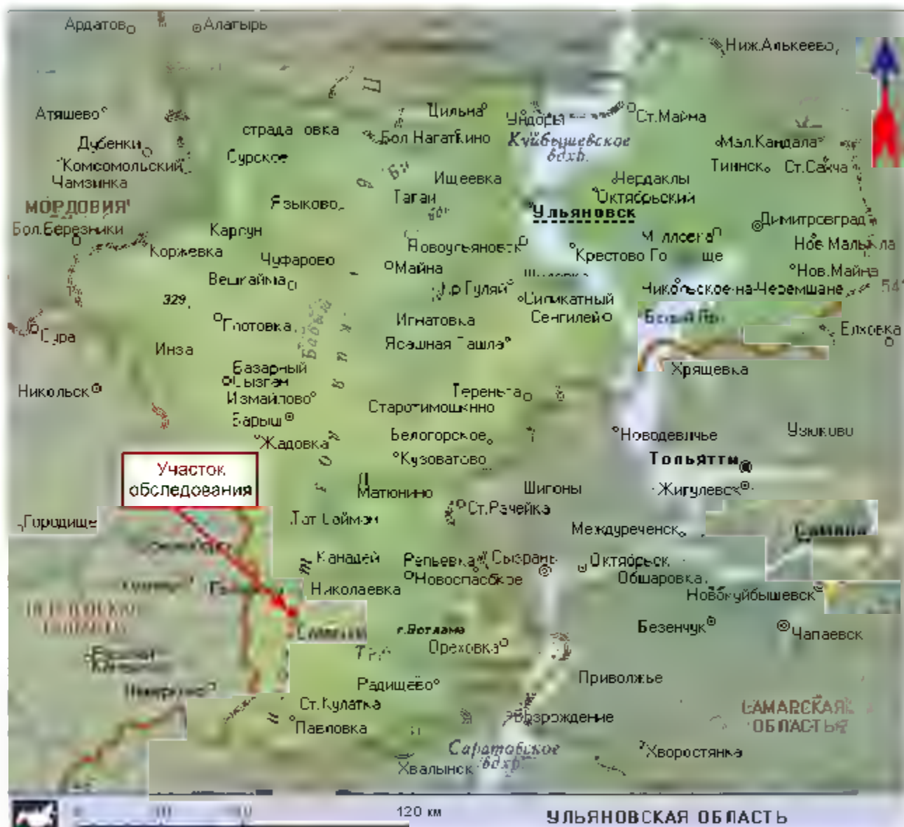
Илл. 1. Археологические разведки на земельных участках, отведенных под размещение объекта: «Ипв. № 15.591-2018 "Реконструкция Детского оздоровительного лагеря "Чайка" (ближе код: 001.2013.10002711) Николаевский район Ульяновской области. Выкопировка из топоосновы. Карта Ульяновской области с обозначением участка исследования.