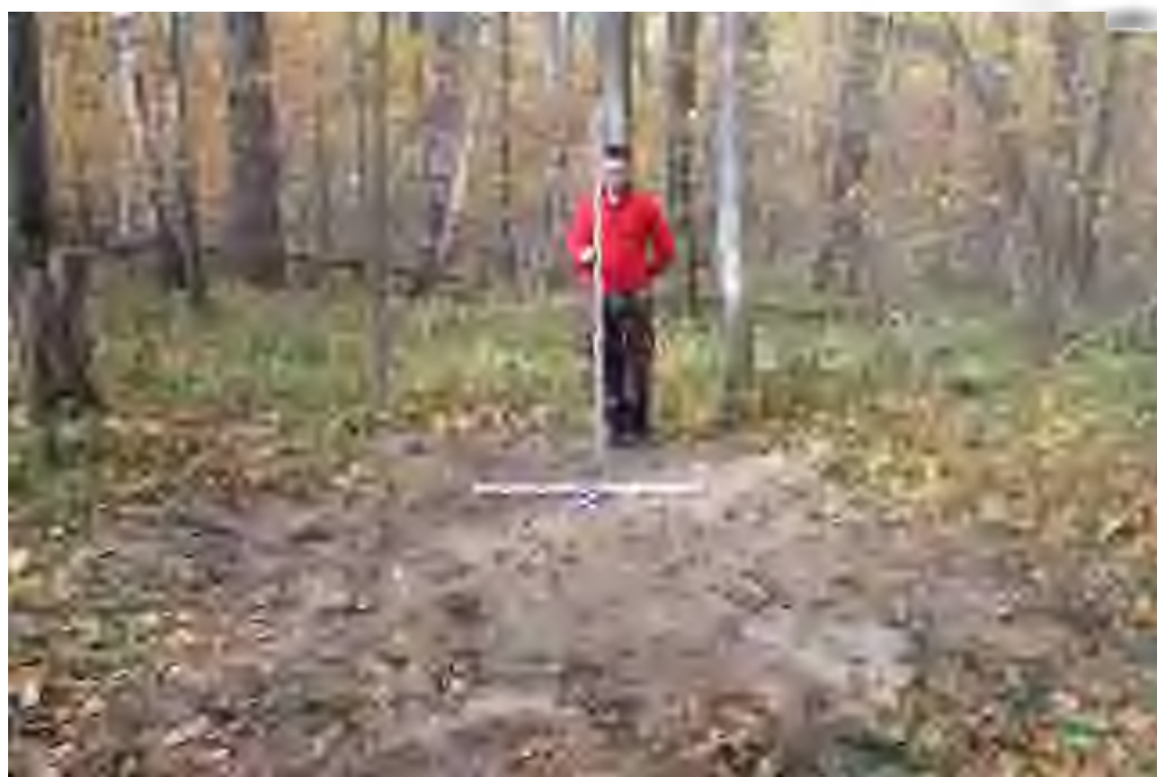
Илл. 54. Археологические разведки на земельных участках, отведенных под размещение объекта: « Итв. № 15591-2018 "Реконструкция Детского оздоровительного лагеря "Чайка" (бизнес код: 001.2013.10002711) Николаевский район Ульяновской области. Рекультивированный шурф №3. Вид с Ю.