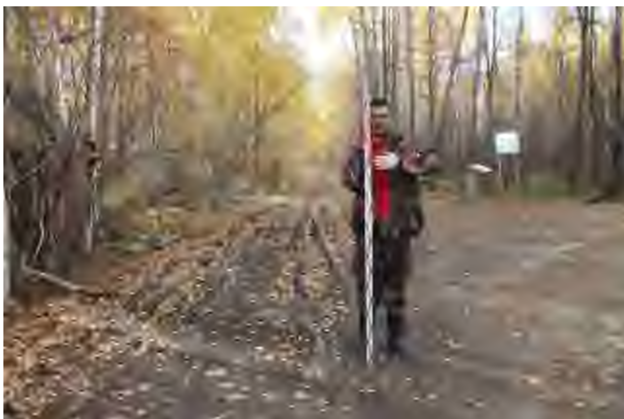
Илл. 36. Археологические разведки на земельных участках, отведенных под расположение объекта: « Инв. № 15591-2018 "Реконструкция Детского оздоровительного лагеря "Чайка" (бизнес код: 001.2013.10002711) Николаевский район Ульяновской области. Точка фотофиксации №9. Вид с З.