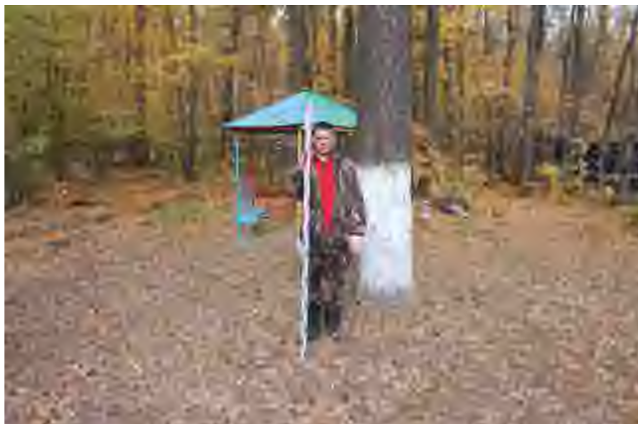
Илл. 39. Археологические разведки на земельных участках, отведенных под расположение объекта: « Инв. № 15591-2018 "Реконструкция Детского оздоровительного лагеря "Чайка" (бизнес код: 001.2013.10002711) Николаевский район Ульяновской области. Точка фотофиксации №10. Вид с Ю.