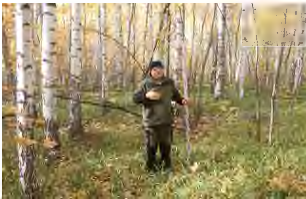
Илл. 10. Археологические разведки на земельных участках, отведенных под размещение объекта: « Инв. № 15591-2018 "Реконструкция Детского оздоровительного лагеря "Чайка" (бизнес код: 001.2013.10002711) Николаевский район Ульяновской области. Точка фотофиксации №2. Вид с В.