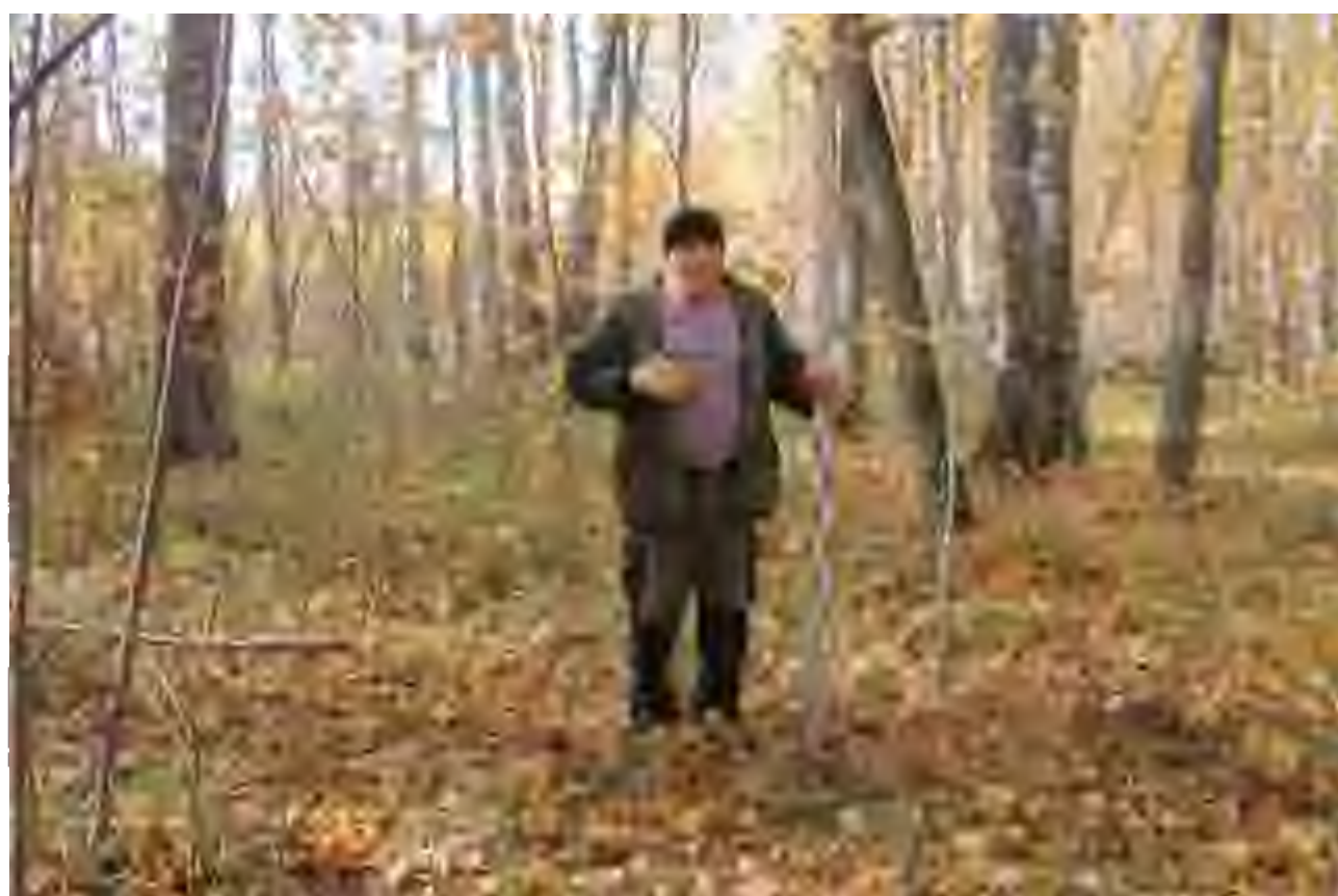
Илл. 18. Археологические разведки на земельных участках, отведенных под расположение объекта: « Инв. № 15591-2018 "Реконструкция Детского оздоровительного лагеря "Чайки" (бизнес код: 001.2013.10002711) Николаевский район Ульяновской области. Точка фотофиксации №4. Вид с В.