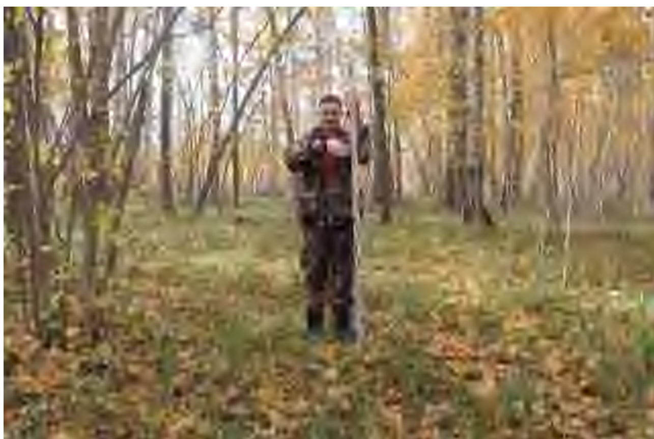
Илл. 16. Археологические разведки на земельных участках, отведенных под размещение объекта: « Иив. № 15591-2018 "Реконструкция Детского оздоровительного лагеря "Чайка" (бизнес код: 001.2013.10002711) Николаевский район Ульяновской области. Точка фотофиксации №3. Вид с В.