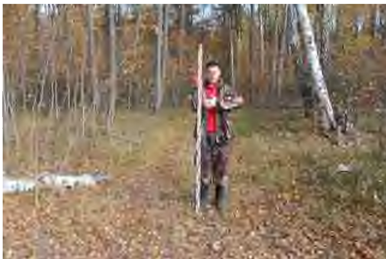
Илл. 28. Археологические разведки на земельных участках, отведенных под расположение объекта: « Инв. № 15591-2018 "Реконструкция Детского оздоровительного лагеря "Чайка" (бизнес код: 001.2013.10002711) Николаевский район Ульяновской области. Точка фотофиксации №7. Вид с З.