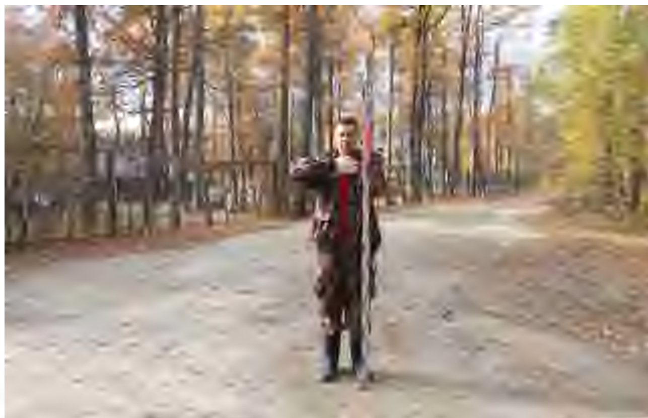
Илл. 37. Археологические разведки на земельных участках, отведенных под расположение объекта: « Иив. № 15591-2018 "Реконструкция Детского оздоровительного лагеря "Чайка" (бизнес код: 001.2013.10002711) Николаевский район Ульяновской области. Точка фотофиксации №9. Вид с В.