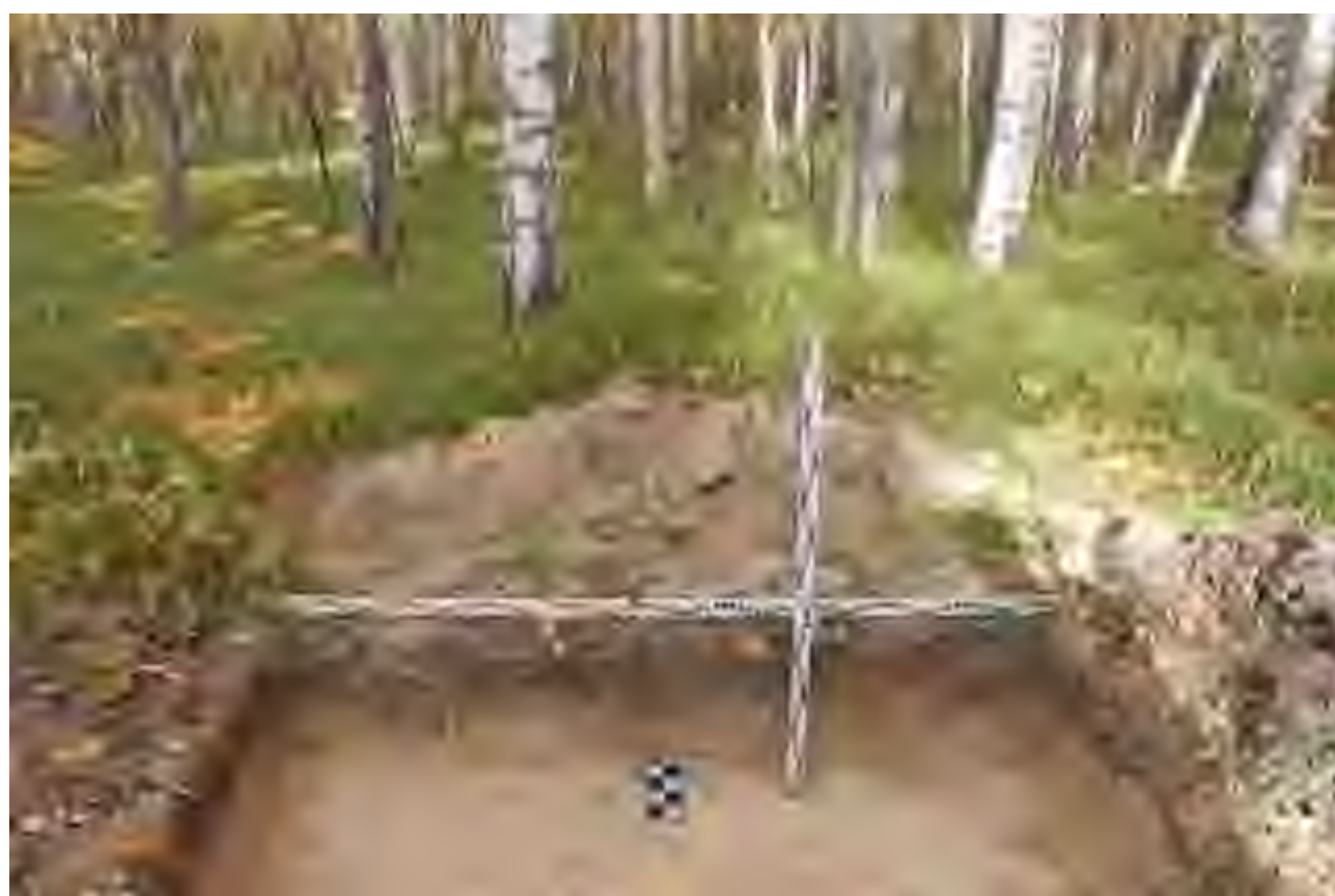
Илл. 48. Археологические разведки на земельных участках, отведенных под размещение объекта: « Итв. № 15591-2018 "Реконструкция Детского оздоровительного лагеря "Чайка" (бизнес код: 001.2013.10002711) Николаевский район Ульяновской области. Материк. Шурф №2. Вид с Ю.