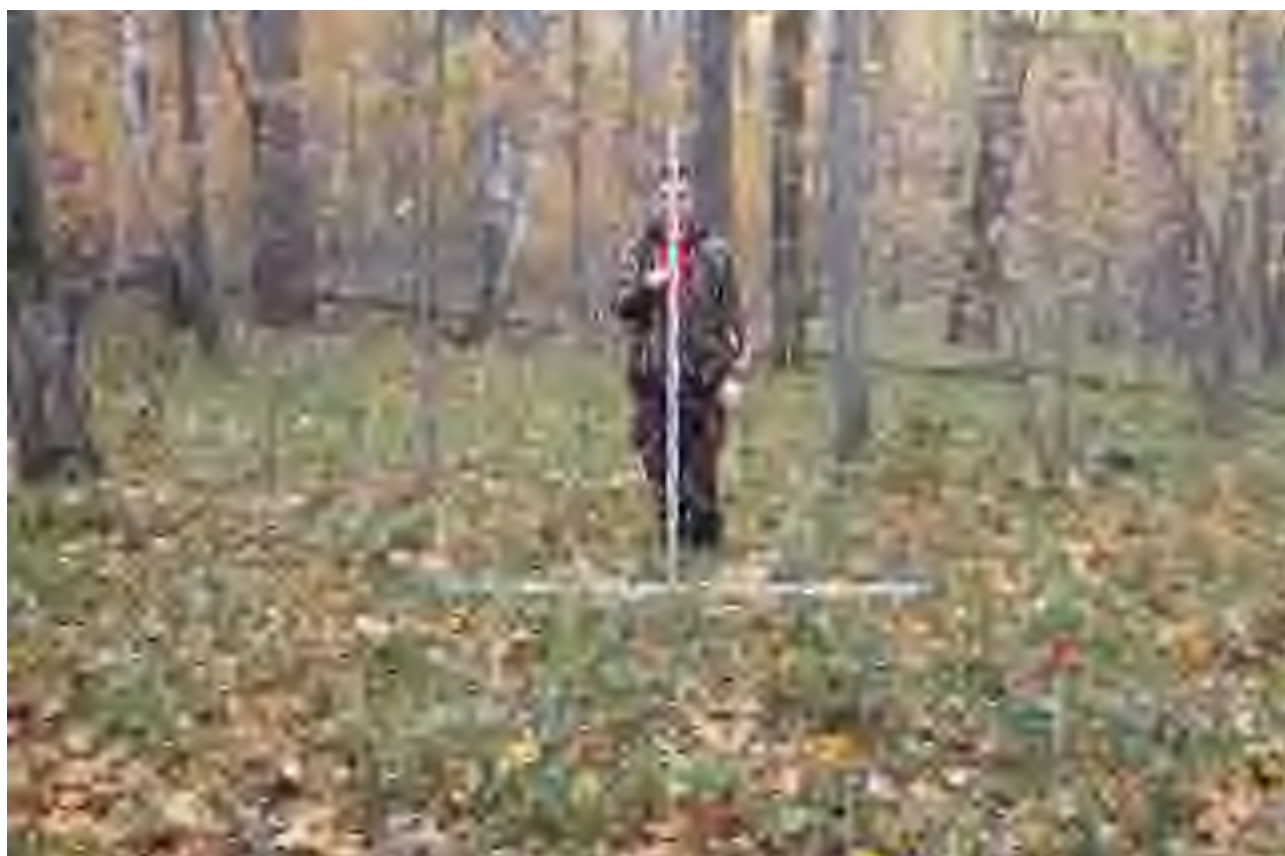
Илл. 51. Археологические разведки на земельных участках, отведенных под размещение объекта: « Ипв. № 15591-2018 "Реконструкция Детского оздоровительного лагеря "Чайка" (бизнес код: 001.2013.10002711) Николаевский район Ульяновской области. Размеченный шурф №3. Вид с Ю.