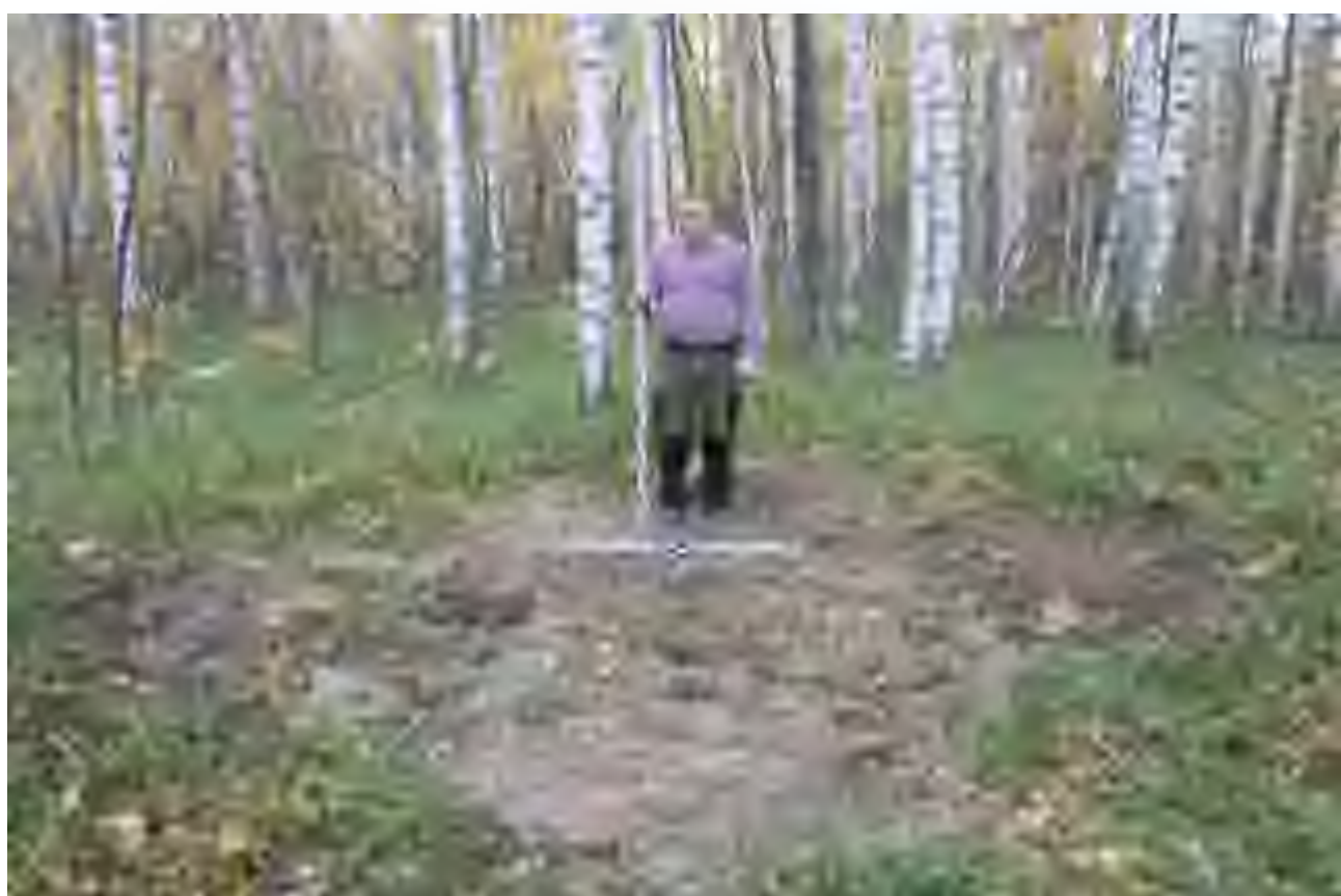
Илл. 50. Археологические разведки на земельных участках, отведенных под расположение объекта: « Ивл. № 15591-2018 "Реконструкция Детского оздоровительного лагеря "Чайка" (бизнес код: 001.2013.10002711) Николаевский район Ульяновской области. Рекультивирующий шурф №2. Вид с Ю.