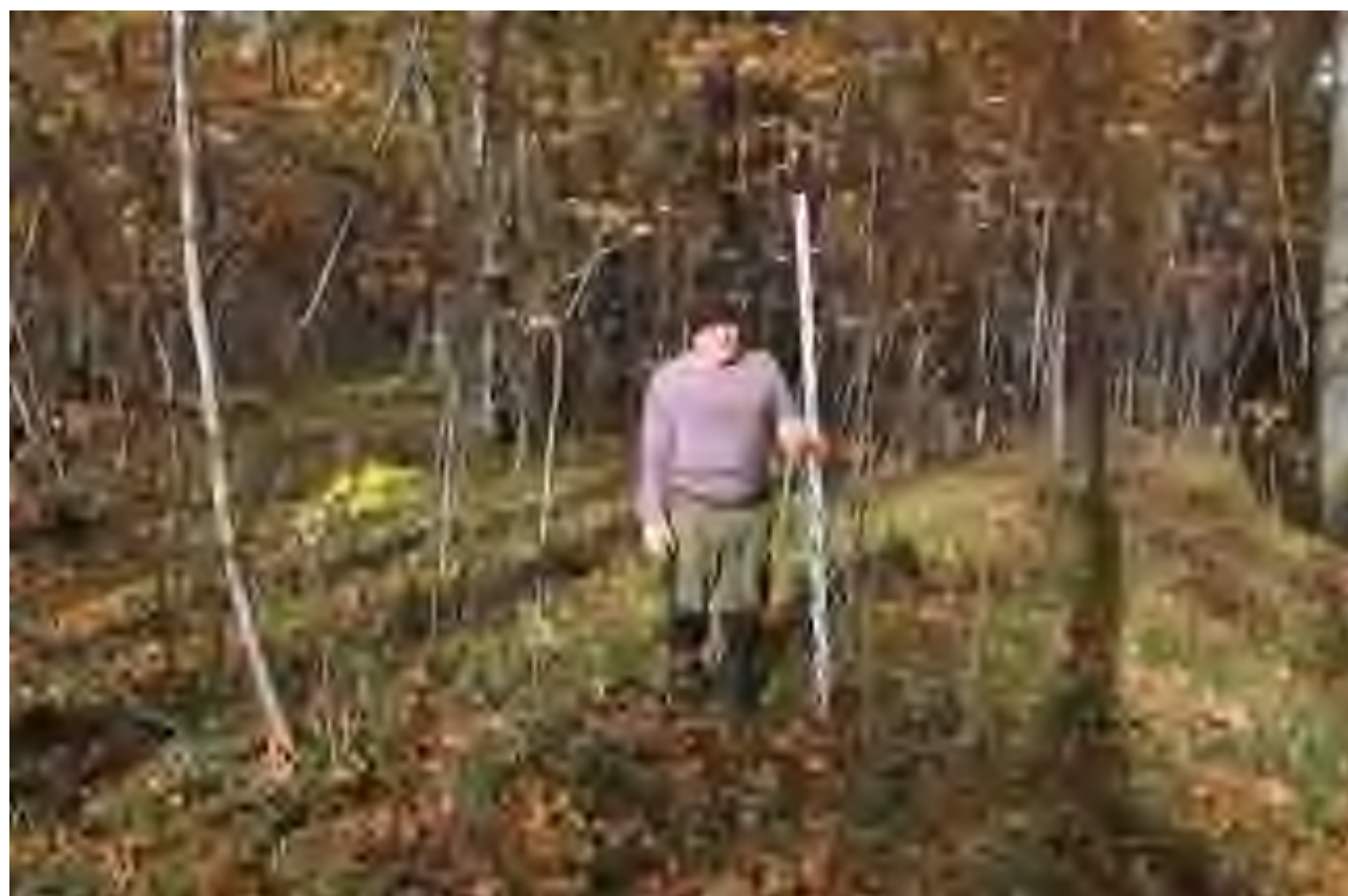
Илл. 21. Археологические разведки на земельных участках, отведенных под размещение объекта: « Инв. № 15591-2018 "Реконструкция Детского оздоровительного лагеря "Чайка" (бизнес код: 001.2013.10002711) Николаевский район Ульяновской области. Точка фотофиксации №5. Вид с Ю.