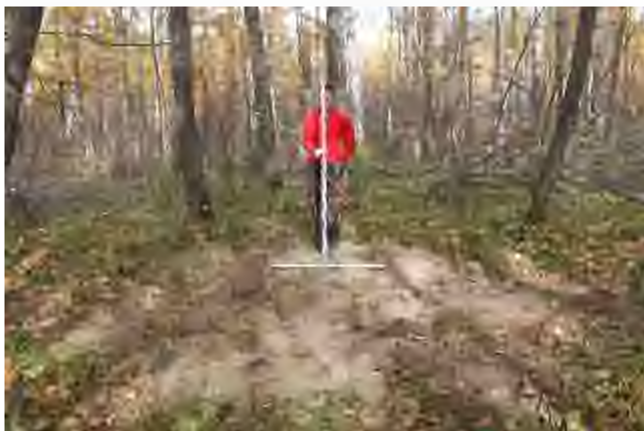
Илл. 46. Археологические разведки на земельных участках, отведенных под размещение объекта: « Инв. № 15591-2018 "Реконструкция Детского оздоровительного лагеря "Чайка" (бизнес код: 001.2013.10002711) Николаевский район Ульяновской области. Рекультивирующий шурф №1. Вид с Ю.