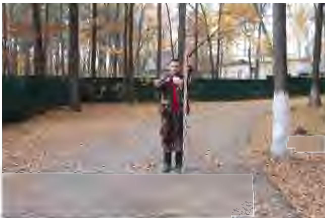
Илл. 42. Археологические разведки на земельных участках, отведенных под расположение объекта: « Инв. № 15591-2018 "Реконструкция Детского оздоровительного лагеря "Чайка" (бизнес код: 001.2013.10002711) Николаевский район Ульяновской области. Точка фотофиксации №10. Виде В.