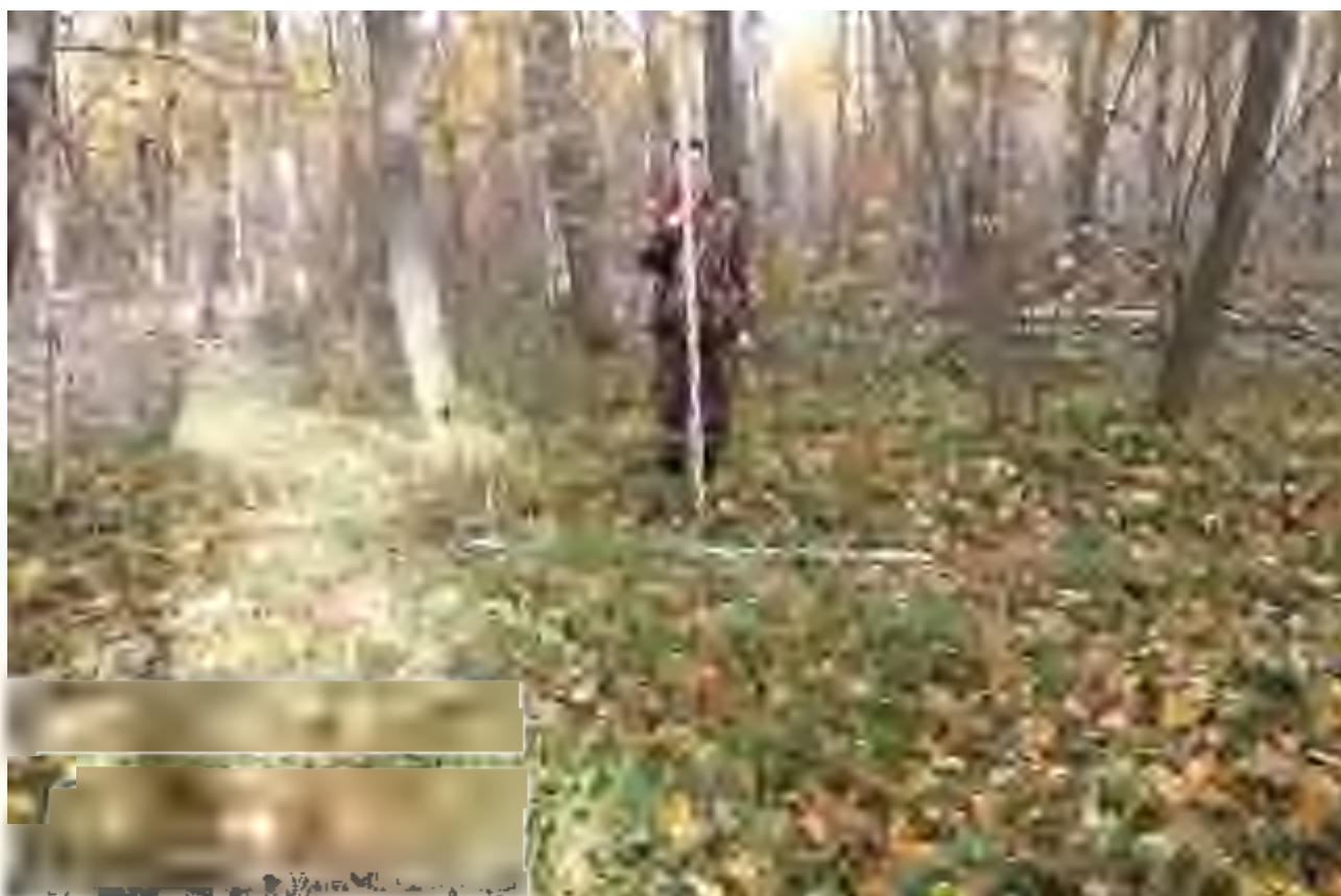
Илл. 43. Археологические разведки на земельных участках, отведенных под размещение объекта: « Ипв. № 15591-2018 "Реконструкция Детского оздоровительного лагеря "Чайка" (бизнес код: 001.2013.10002711) Николаевский район Ульяновской области. Размеченный шурф №1. Вид с Ю.