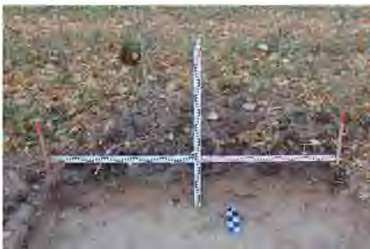
Илл. 56. Археологические разведки на земельных участках, отведенных под размещение объекта: « Иив. № 15591-2018 "Реконструкция Детского оздоровительного лагеря "Чайка" (бизнес код: 001.2013.10002711) Николаевский район Ульяновской области. Материк. Шурф №4. Вид с Ю).