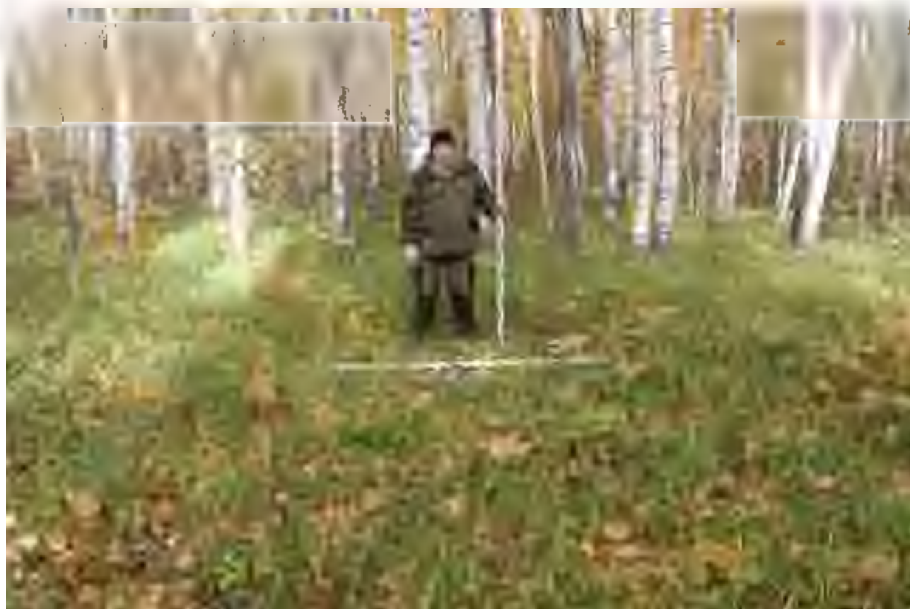
Илл. 47. Археологические разведки на земельных участках, отведенных под размещение объекта: « Итв. № 15591-2018 "Реконструкция Детского оздоровительного лагеря "Чайка" (бизнес код: 001.2013.10002711) Николаевский район Ульяновской области. Размеченный шурф №2. Вид с Ю.