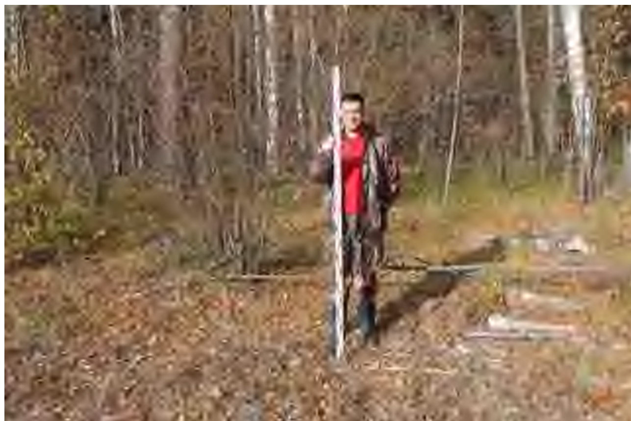
Илл. 27. Археологические разведки на земельных участках, отведенных под расположение объекта: « Инв. № 15591-2018 "Реконструкция Детского оздоровительного лагеря "Чайка" (бизнес код: 001.2013.10002711) Николаевский район Ульяновской области. Точка фотофиксации №7. Вид с Ю.