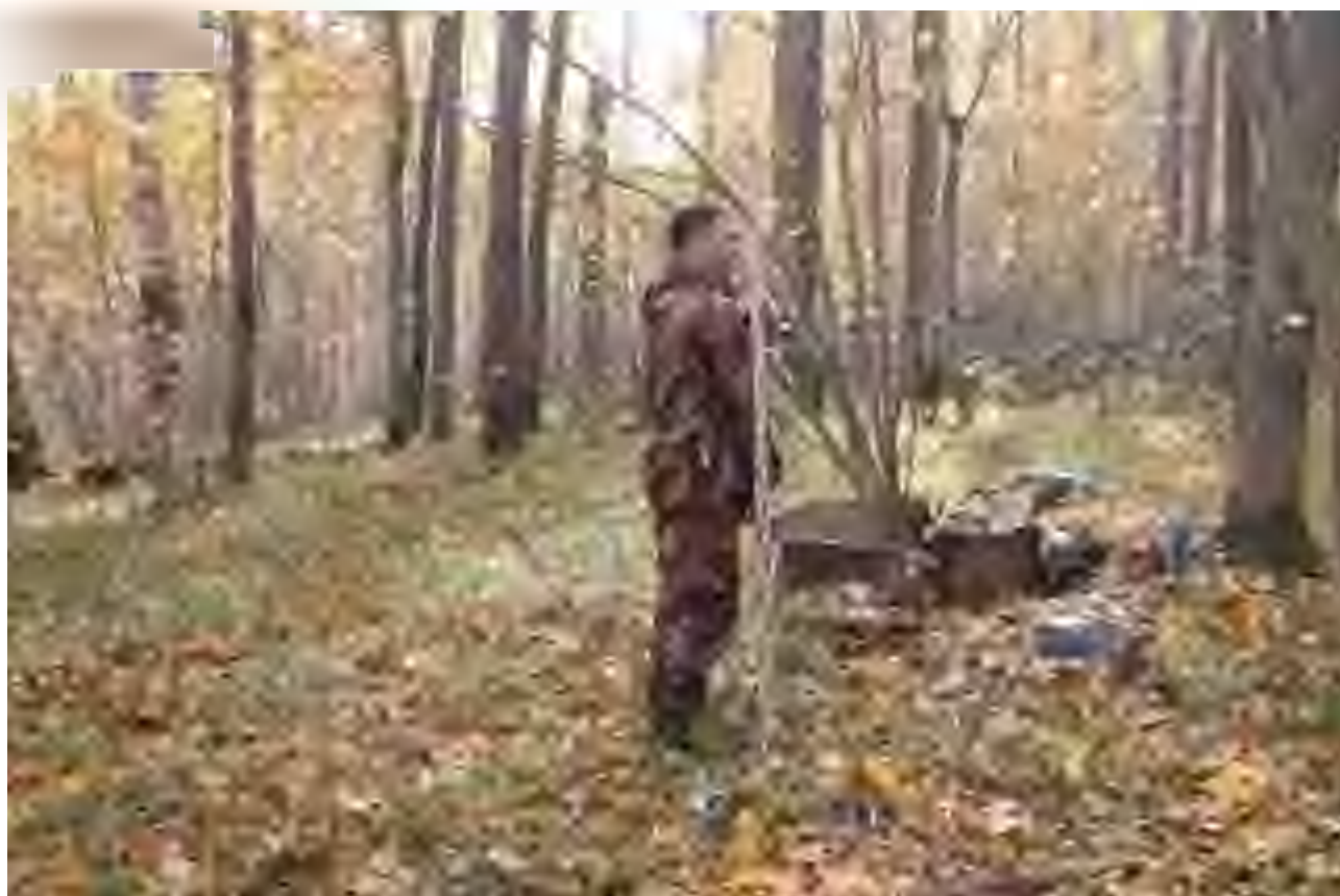
Илл. 15. Археологические разведки на земельных участках, отведенных под размещение объекта: « Иив. № 15591-2018 "Реконструкция Детского оздоровительного лагеря "Чайка" (бизнес код: 001.2013.10002711) Николаевский район Ульяновской области. Точка фотофиксации №3. Вид с С.