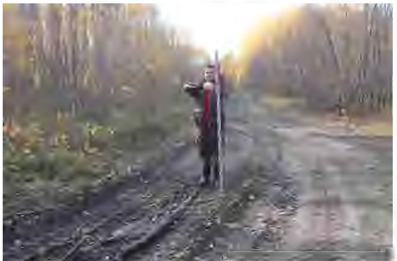
Илл. 32. Археологические разведки на земельных участках, отведенных под размещение объекта: « Инв. № 15591-2018 "Реконструкция Детского оздоровительного лагеря "Чайка" (бизнес код: 001.2013.10002711) Николаевский район Ульяновской области. Точка фотофиксации №8. Вид с В.