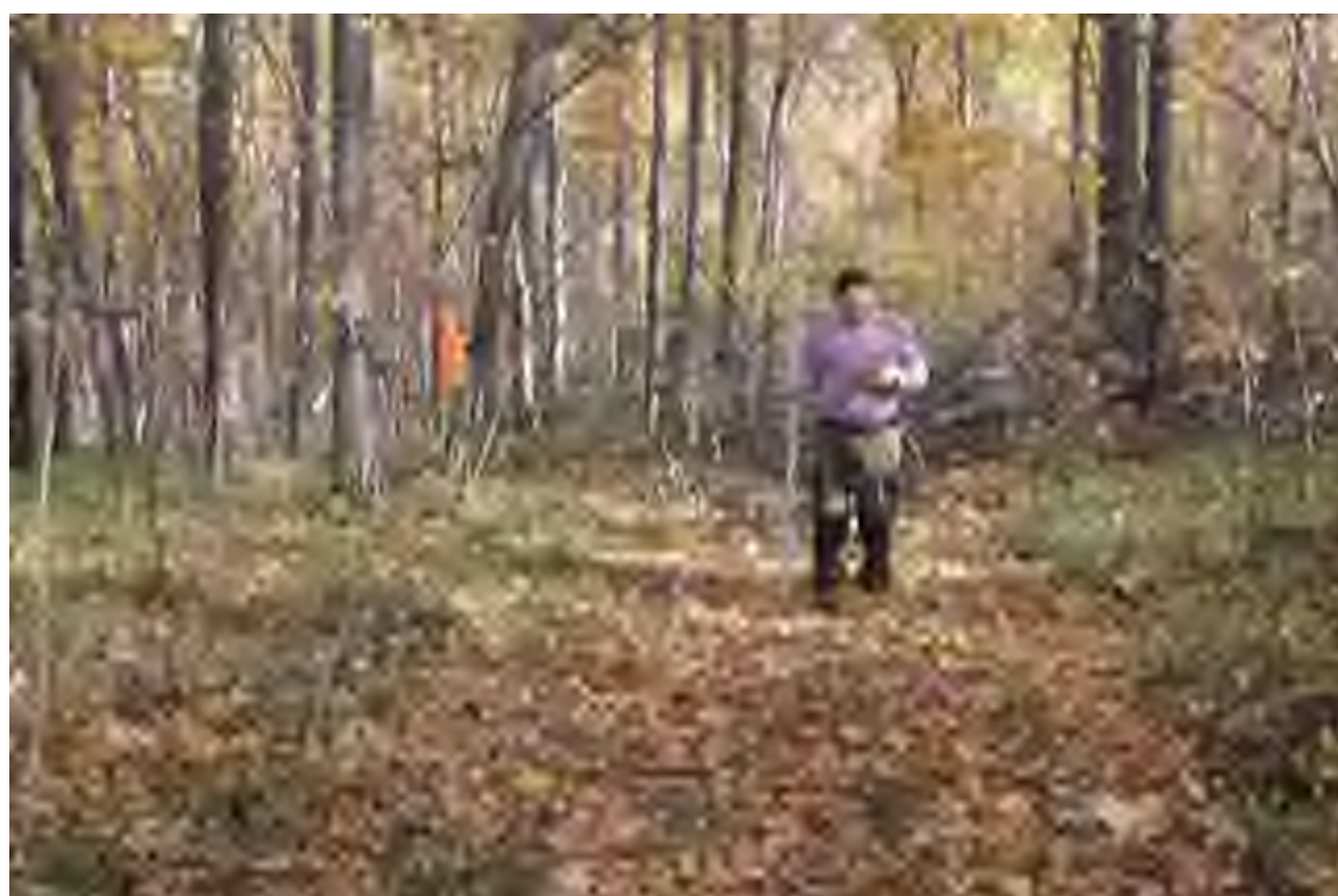
Илл. 24. Археологические разведки на земельных участках, отведенных под размещение объекта: « Ипг. № 15591-2018 "Реконструкция Детского оздоровительного лагеря "Чайка" (бизнес код: 001.2013.10002711) Николаевский район Ульяновской области. Точка фотофиксации №5. Вид с З.