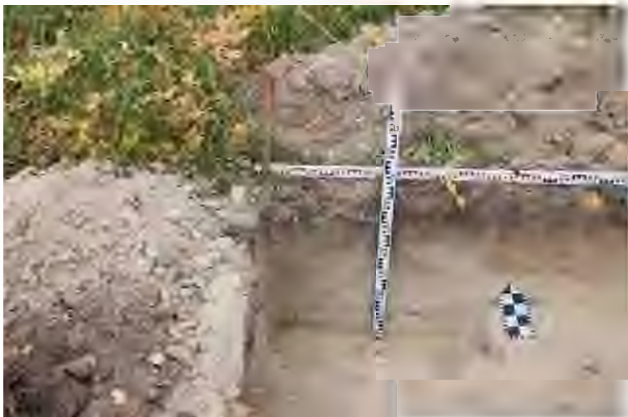
Илл. 49. Археологические разведки на земельных участках, отведенных под расположение объекта: « Ивл. № 15591-2018 "Реконструкция Детского оздоровительного лагеря "Чайка" (бизнес код: 001.2013.10002711) Николаевский район Ульяновской области. Контрольный прокоп. Шурф №2. Вид с Ю.