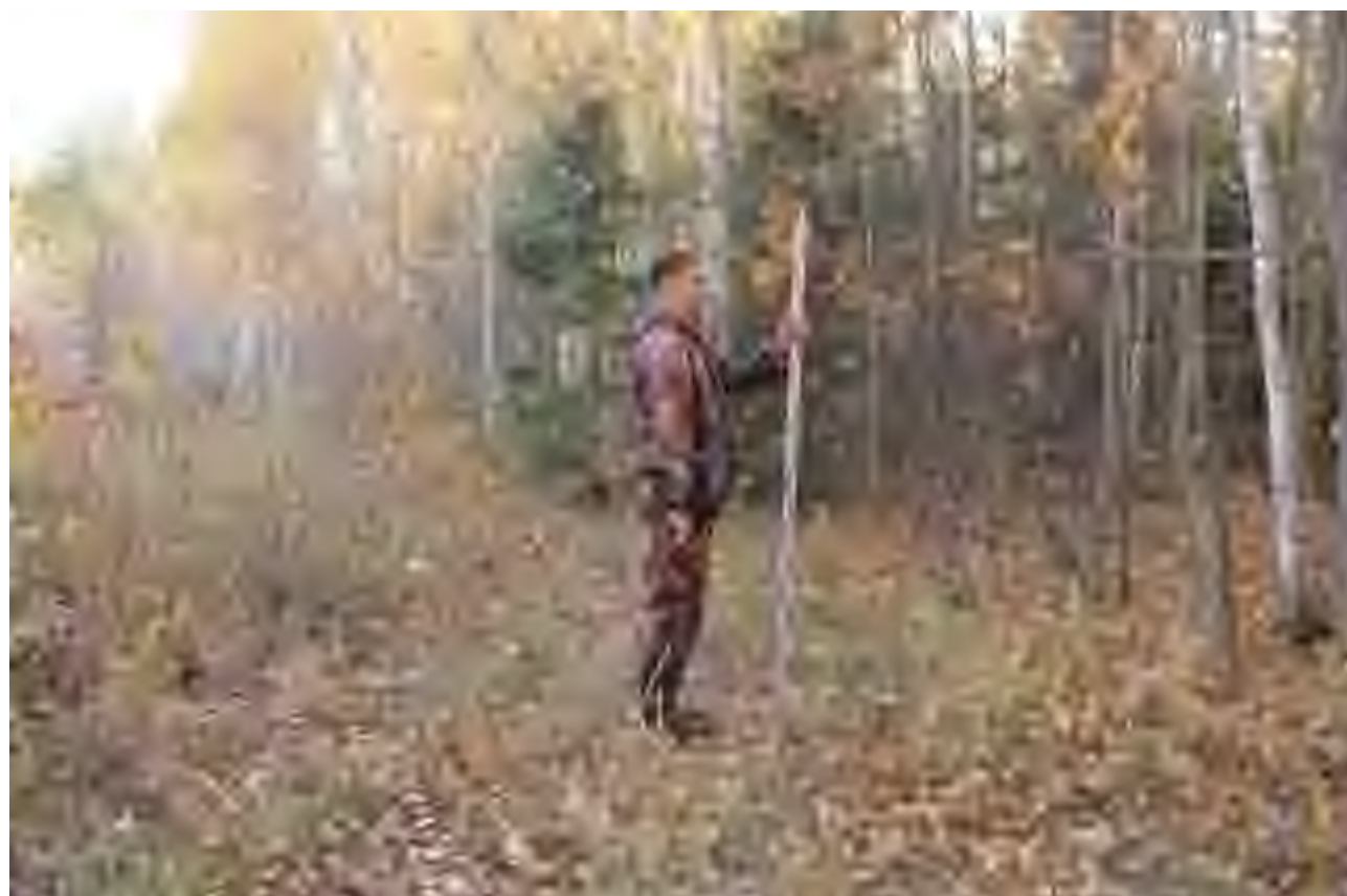
Илл. 29. Археологические разведки на земельных участках, отведенных под расположение объекта: « Инв. № 15591-2018 "Реконструкция Детского оздоровительного лагеря "Чайка" (бизнес код: 001.2013.10002711) Николаевский район Ульяновской области. Точка фотофиксации №7. Вид с С.