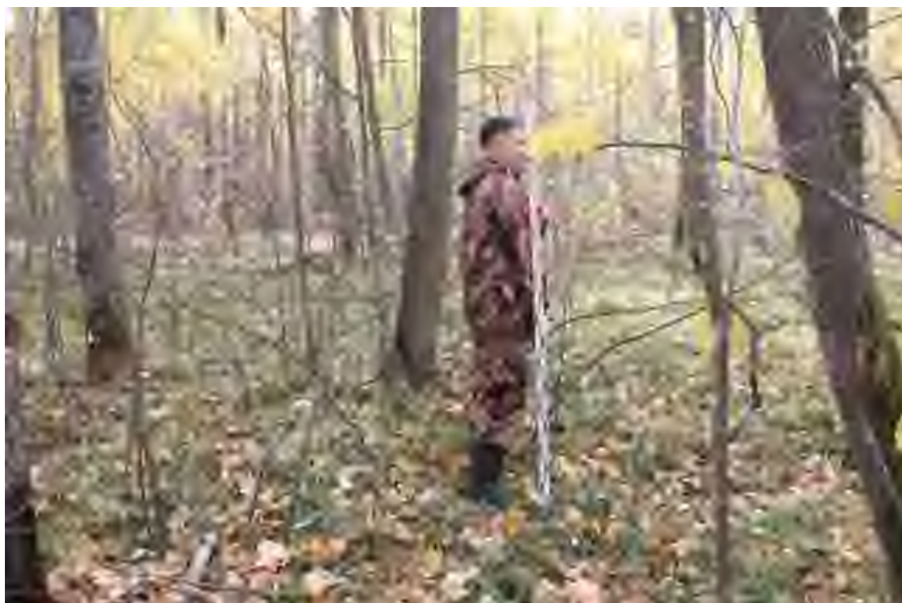
Илл. 7. Археологические разведки на земельных участках, отведенных под размещение объекта, « Ипв. № 15591-2018 "Реконструкция Детского оздоровительного лагеря "Чайка" (бизнес код: 001.2013.10002711) Николаевский район Ульяновской области. Точка фотофиксации №1. Вид с С.