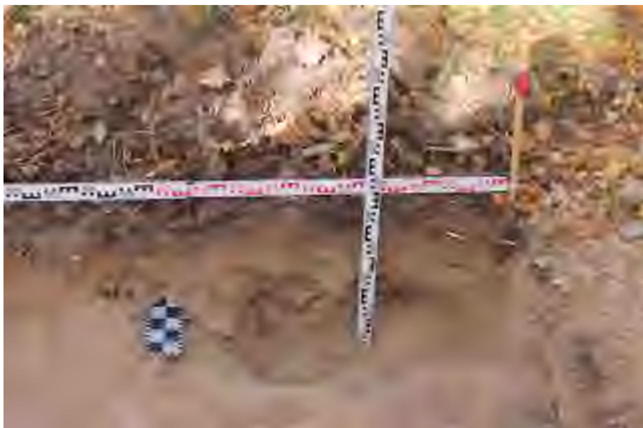
Илл. 57. Археологические разведки на земельных участках, отведенных под размещение объекта: « Итв. № 15591-2018 "Реконструкция Детского оздоровительного лагеря "Чайка" (бизнес код: 001.2013.10002711) Николаевский район Ульяновской области. Контрольный прокоп. Шурф №4. Вид с Ю.