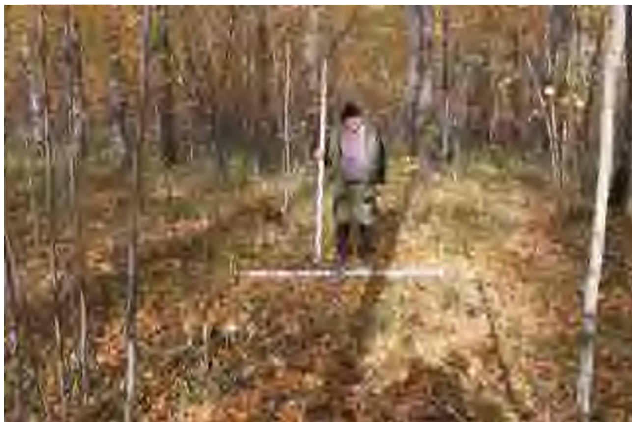
Илл. 55. Археологические разведки на земельных участках, отведенных под размещение объекта: « Иив. № 15591-2018 "Реконструкция Детского оздоровительного лагеря "Чайка" (бизнес код: 001.2013.10002711) Николаевский район Ульяновской области. Размещенный шурф №4. Вид с Ю).