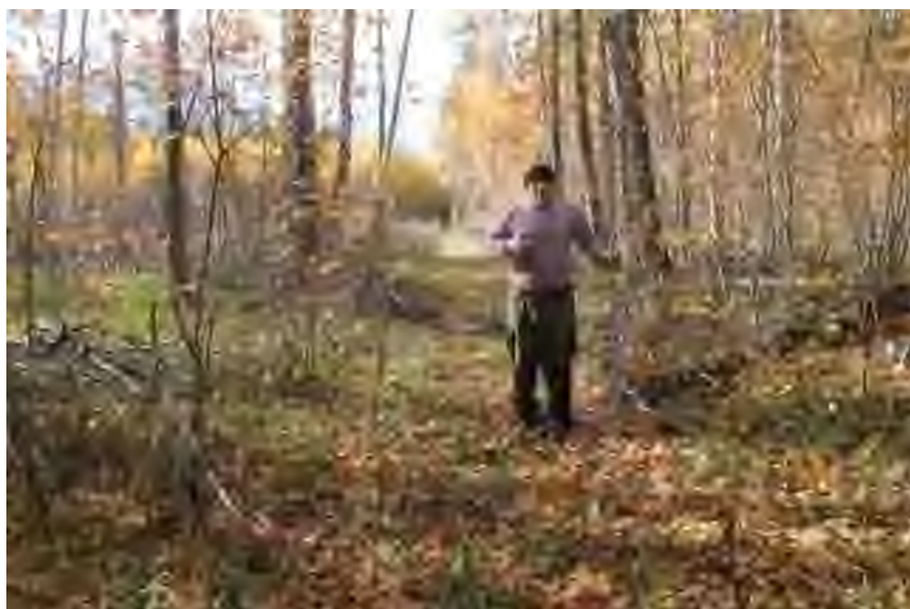
Илл. 22. Археологические разведки на земельных участках, отведенных под размещение объекта: « Инв. № 15591-2018 "Реконструкция Детского оздоровительного лагеря "Чайка" (бизнес код: 001.2013.10002711) Николаевский район Ульяновской области. Точка фотофиксации №5. Вид с В.