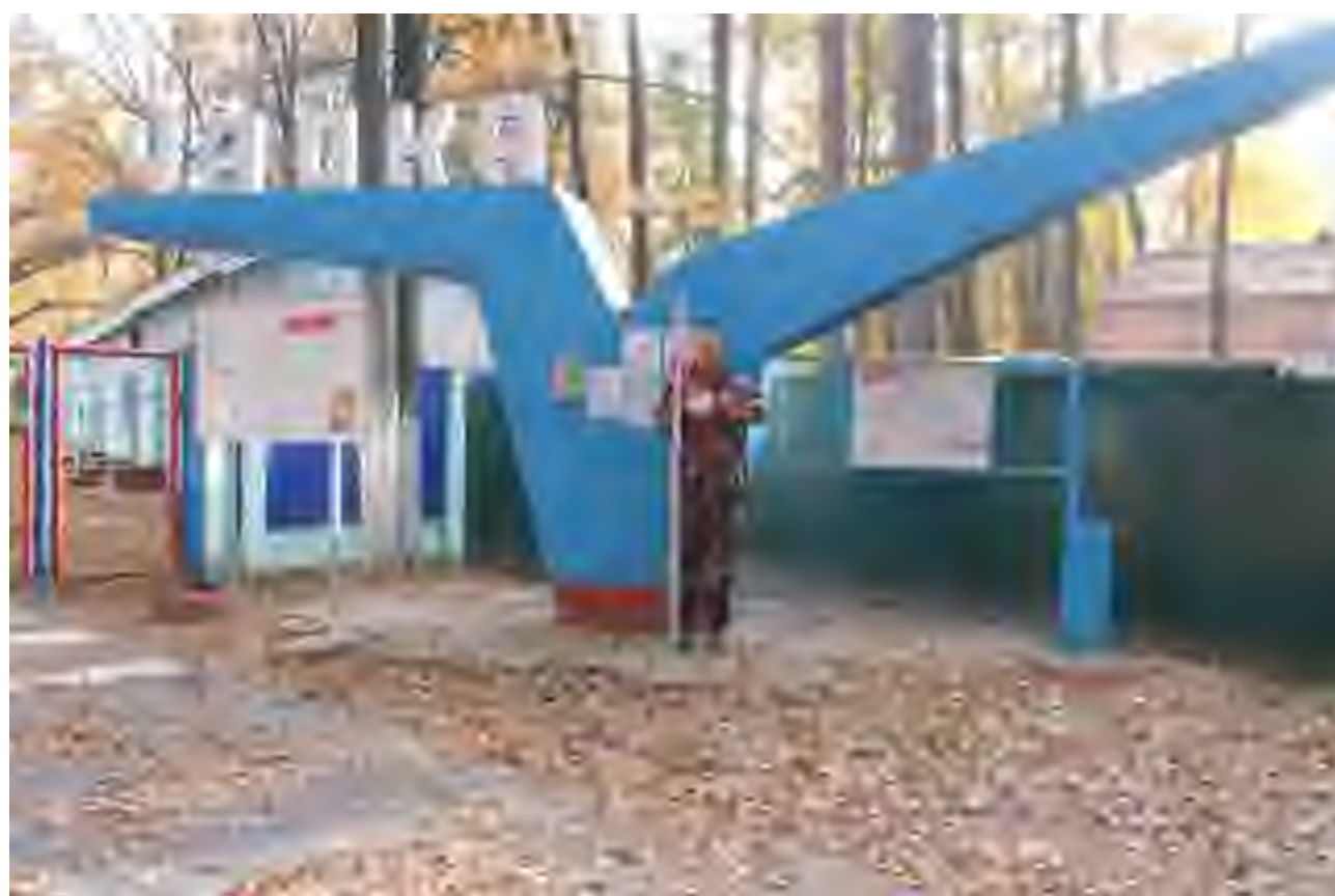
Илл. 40. Археологические разведки на земельных участках, отведенных под расположение объекта: « Инв. № 15591-2018 "Реконструкция Детского оздоровительного лагеря "Чайка" (бизнес код: 001.2013.10002711) Николаевский район Ульяновской области. Точка фотофиксации №10. Вид с З.