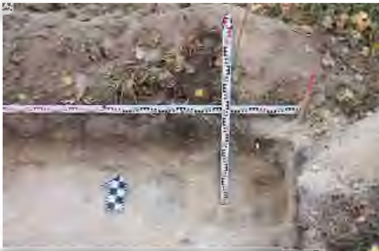
Илл. 45. Археологические разведки на земельных участках, отведенных под размещение объекта: « Инв. № 15591-2018 "Реконструкция Детского оздоровительного лагеря "Чайка" (бизнес код: 001.2013.10002711) Николаевский район Ульяновской области. Контрольный прокоп. Шурф №1. Вид с Ю.