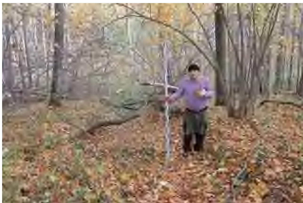
Илл. 26. Археологические разведки на земельных участках, отведенных под расположение объекта: « Инв. № 15591-2018 "Реконструкция Детского оздоровительного лагеря "Чайка" (бизнес код: 001.2013.10002711) Николаевский район Ульяновской области. Точка фотофиксации №6. Вид с З.