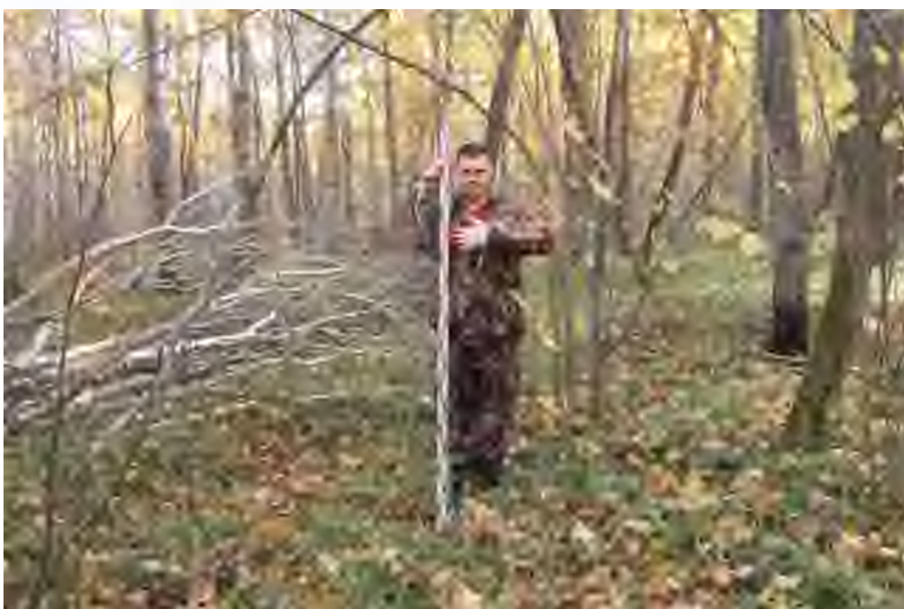
Илл. 6. Археологические разведки на земельных участках, отведенных под размещение объекта: «Ипп. № 15591-2018 "Реконструкция Детского оздоровительного лагеря "Чайка" (бизнес код: 001.2013.10002711) Николаевский район Ульяновской области. Точка фотофиксации №1. Вид с З.