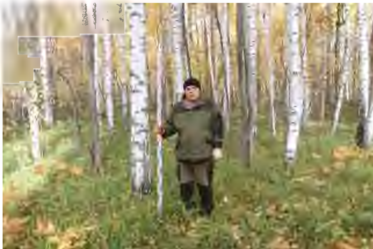
Илл. 9. Археологические разведки на земельных участках, отведенных под размещение объекта: « Инв. № 15591-2018 "Реконструкция Детского оздоровительного лагеря "Чайка" (бизнес код: 001.2013.10002711) Николаевский район Ульяновской области. Точка фотофиксации №2. Вид с Ю.