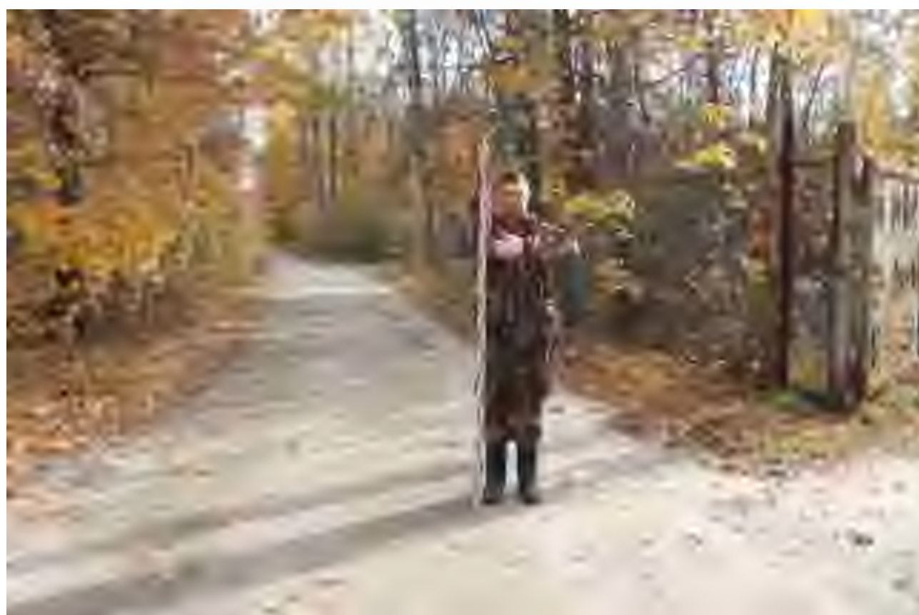
Илл. 38. Археологические разведки на земельных участках, отведенных под расположение объекта: « Иив. № 15591-2018 "Реконструкция Детского оздоровительного лагеря "Чайка" (бизнес код: 001.2013.10002711) Николаевский район Ульяновской области. Точка фотофиксации №9. Вид с З.