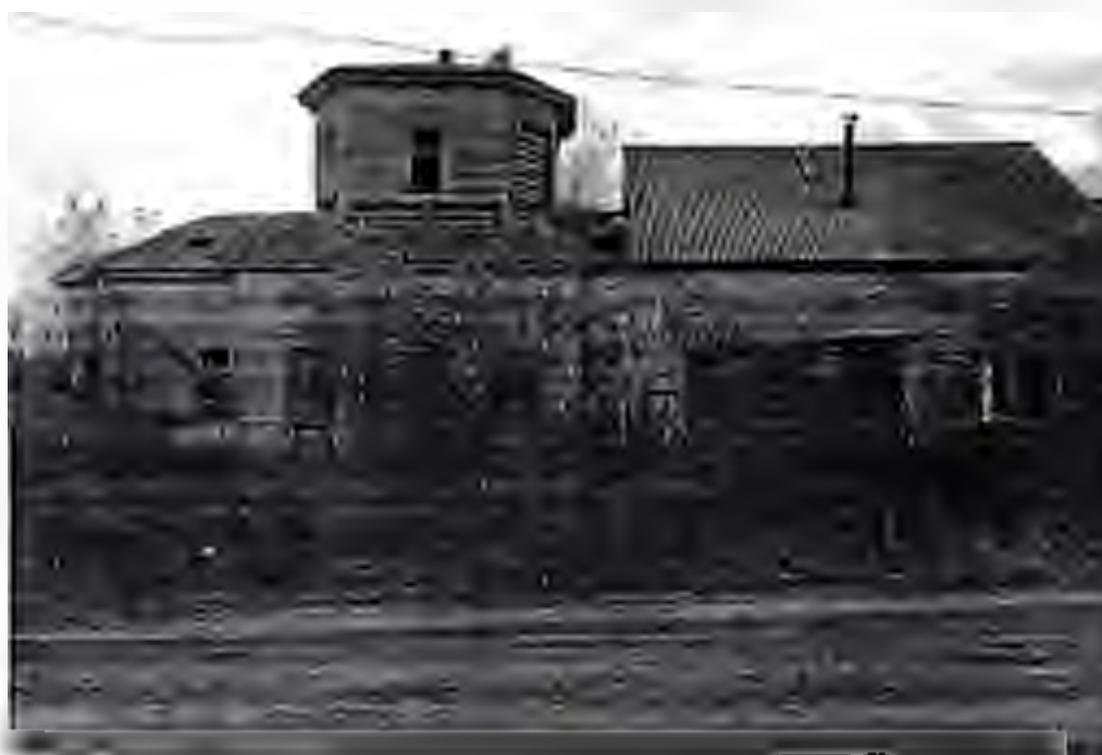
Общий вид объект

Фотофиксация выявленного объекта культурного наследия «Церковь в честь Богоявления Господни (православный двухпрестольный храм)», 1869 г., ( Ульяновская область, Барышский район, с. Головцево, ул. Заречная)