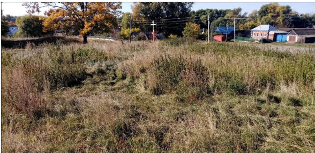
Фотофиксация выявленного объекта культурного наследия «Фундамент утраченной православной приходской трёхпрестольной церкви Живоначальной Троицы», 1746 г., XVIII (?), XVIII - нач. XX вв.» (Ульяновская область, Тереньгульский район, с. Красноборск, центр). Фото на момент проведения экспертизы.