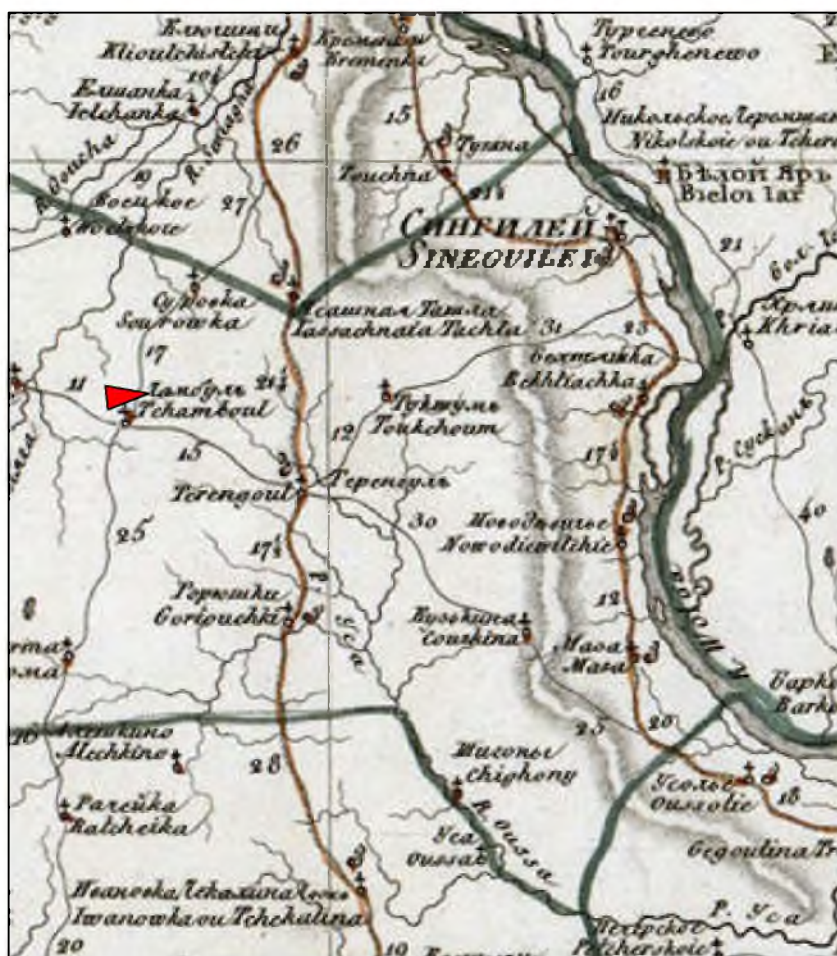
Фрагмент карты 1821 г. Стрелкой показано село Чамбул.