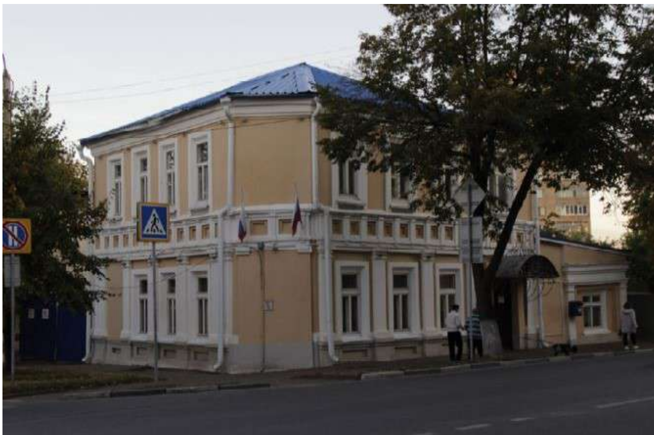
Вид с ул. Кузнецова на северо-западный (главный) и северо-восточный фасады здания (Объект).