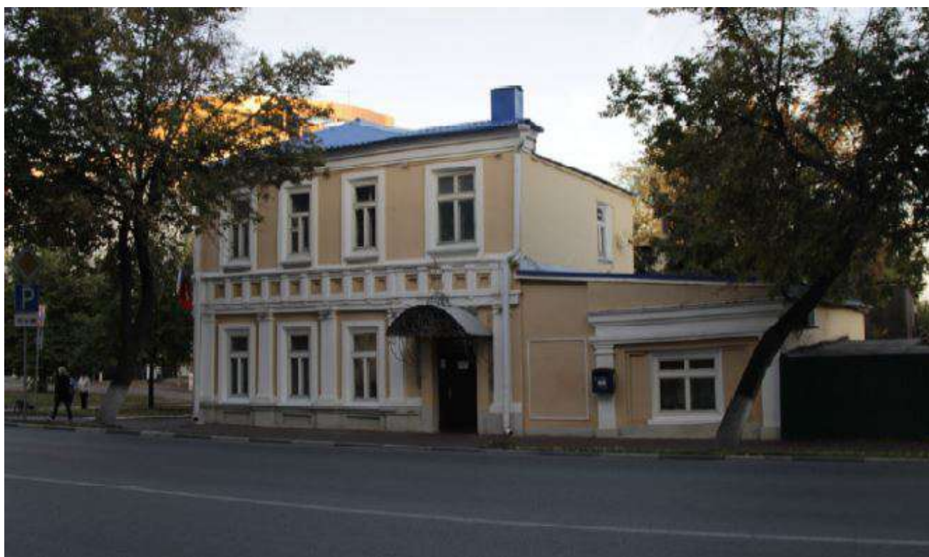
Вид с ул. Кузнецова на северо-западный (главный) фасад здания (Объект).