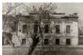
Фото 1 (1983 г.)