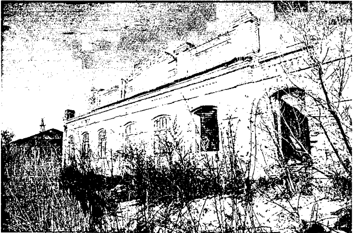
Общий вид на объект с улицы Заречная

Фотофиксация выявленного объекта культурного наследия «Здание школы», 1915 г., расположенного по адресу: Ульяновская область, Ульяновский район, с. Теплошское, ул. Заречная, д. 36