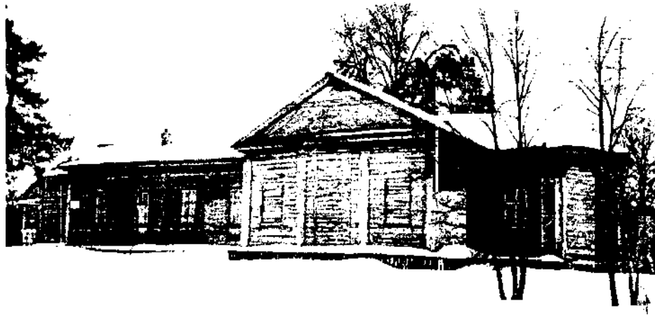
Общий вид объект

Фотофиксация выявленного объекта культурного наследия «Церковь Архангела Михаила (православный приходской теплый храм)», 1701, 1865, 1892 гг., расположенного по адресу: Ульяновская область, Тереньгульский район, с. Гладчиха, ул. Центральная, 25Б