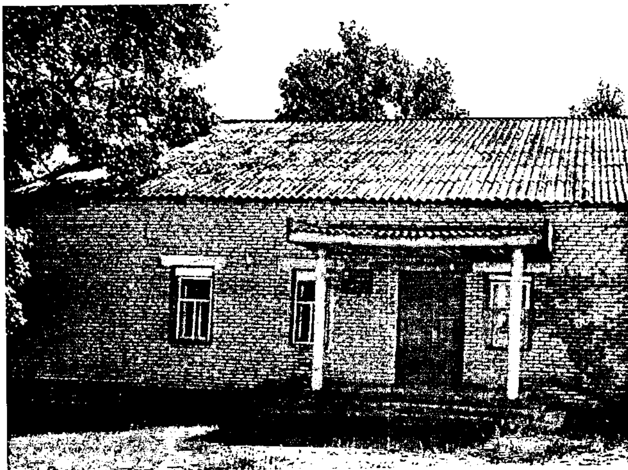
Общий вид Храма

Фотофиксация выявленного объекта культурного наследия «Храм во имя Святого великомученика Дмитрия Солунского» 1712 г., расположенного по адресу: Ульяновская область, Новоспасский район, с. Самайкино