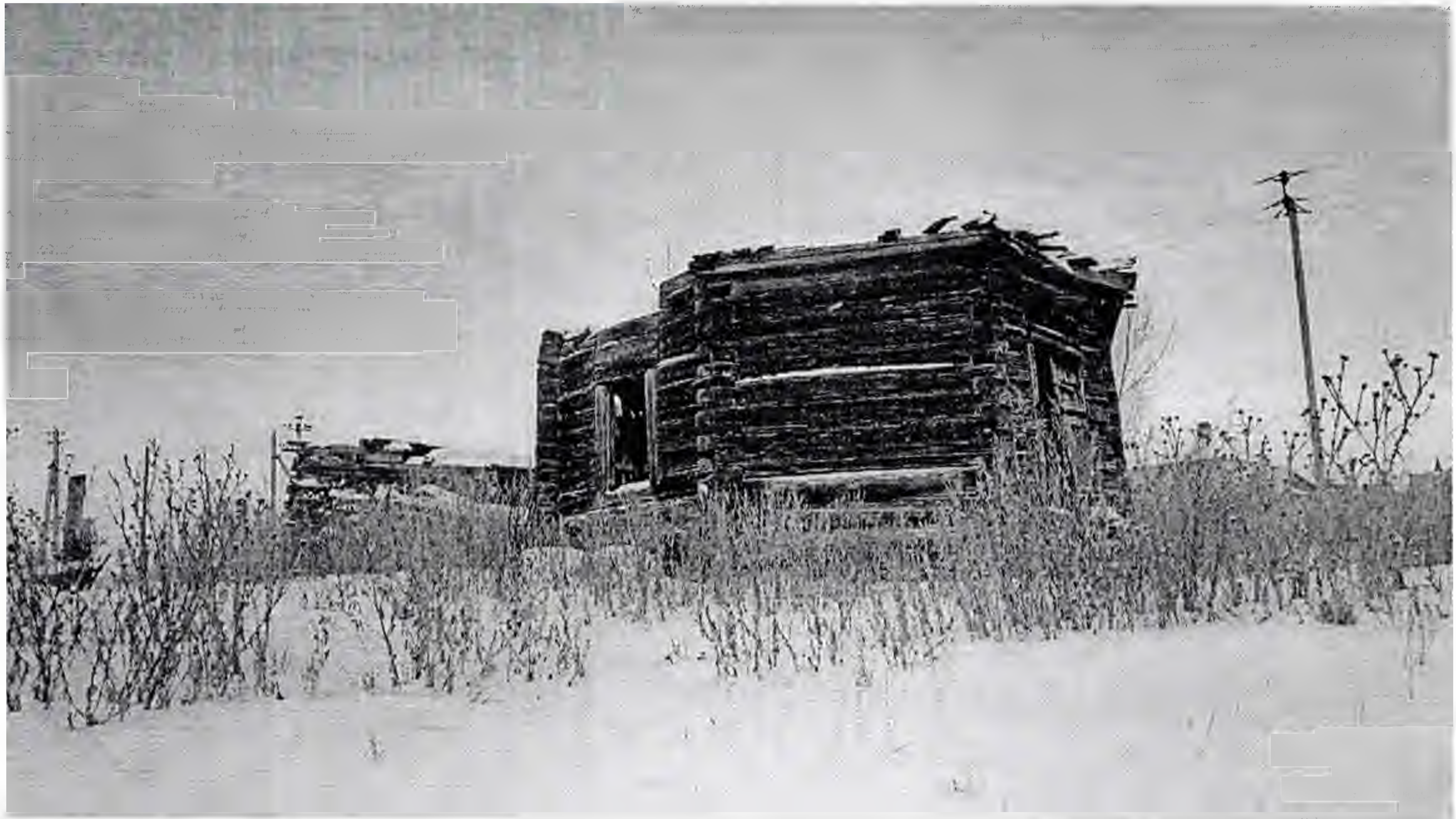
Общий вид объект

Фотофиксация выявленного объекта культурного наследия «Церковь православная приходская» 1910-е гг., расположенного по адресу: Ульяновская область, Николаевский район, с. Кравково, центр