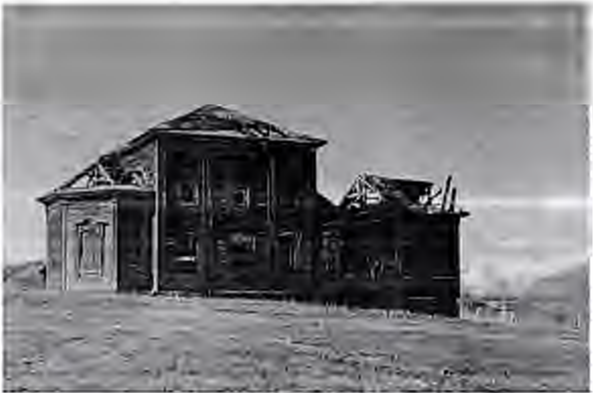
Общий вид объект

Фотофиксация выявленного объекта культурного наследия «Церковь во имя Николая Чудотворца (православный приходской однопрестольный храм)», 1896 г., ( Ульяновская область, Барышский район, с. Смольково, центральная часть)