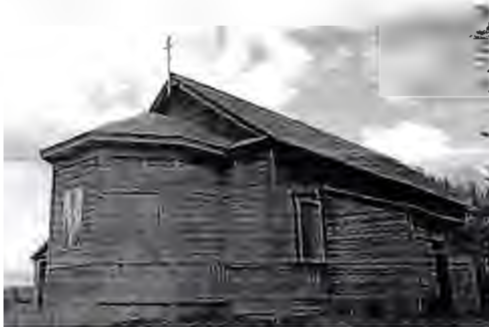
Общий вид объект

Фотофиксация выявленного объекта культурного наследия «Церковь в честь Животворящей Троицы (православный однопрестольный храм)», 1879; 1899 г., ( Удьяновская область, Барышский район, с. Мордовская Темризань, центр села)