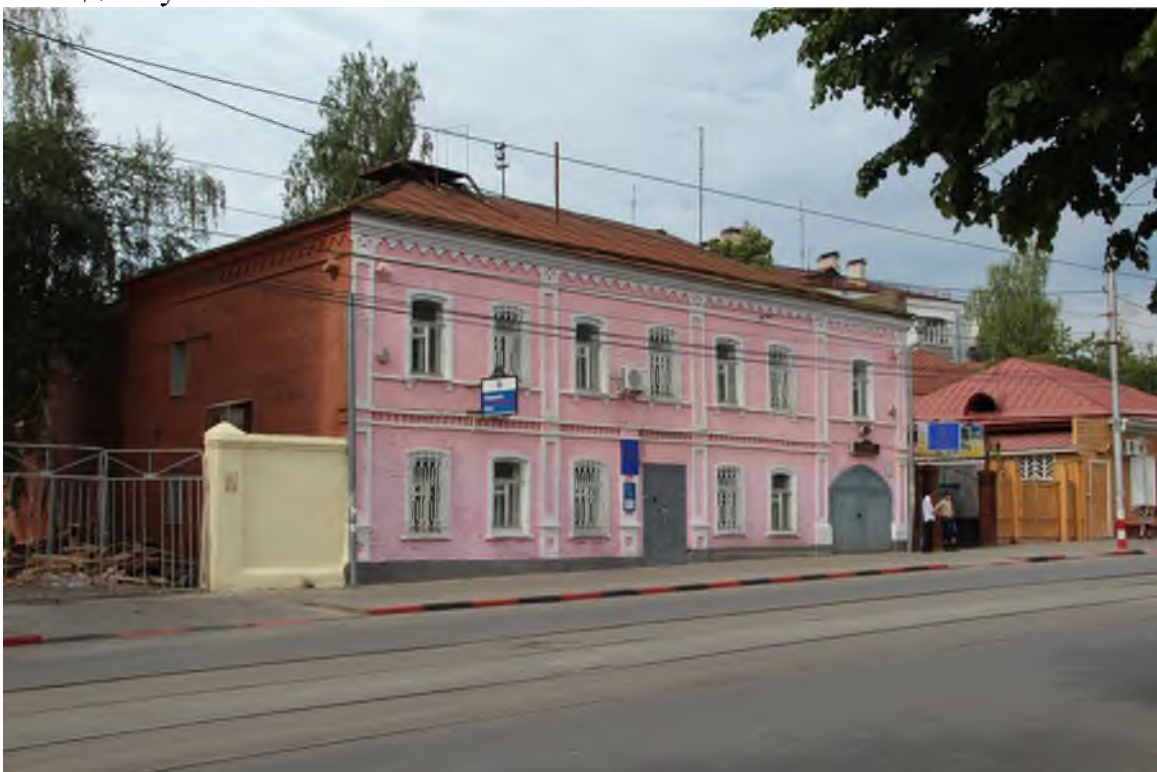
Вид с юго-запада