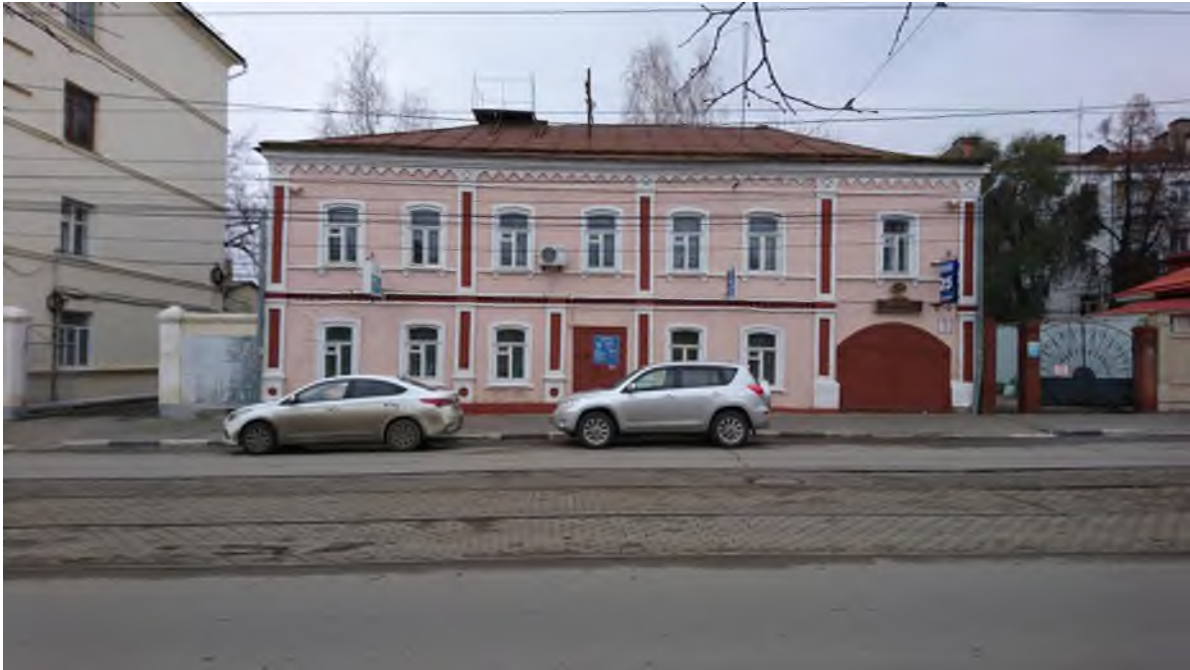
Фасад по ул. Ленина