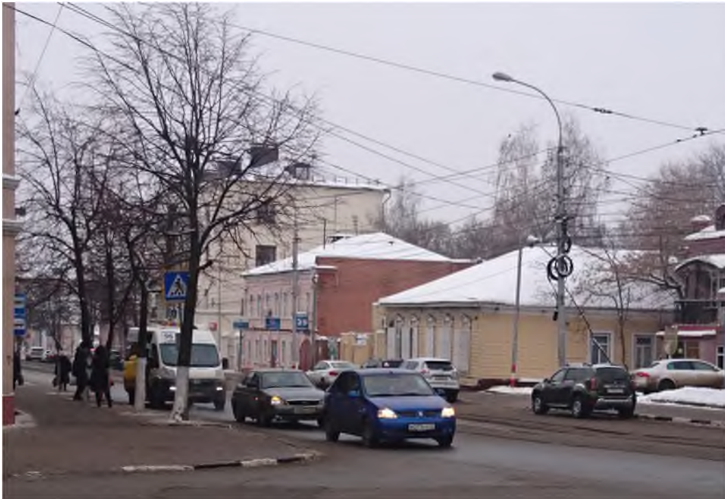
Вид с юго-востока