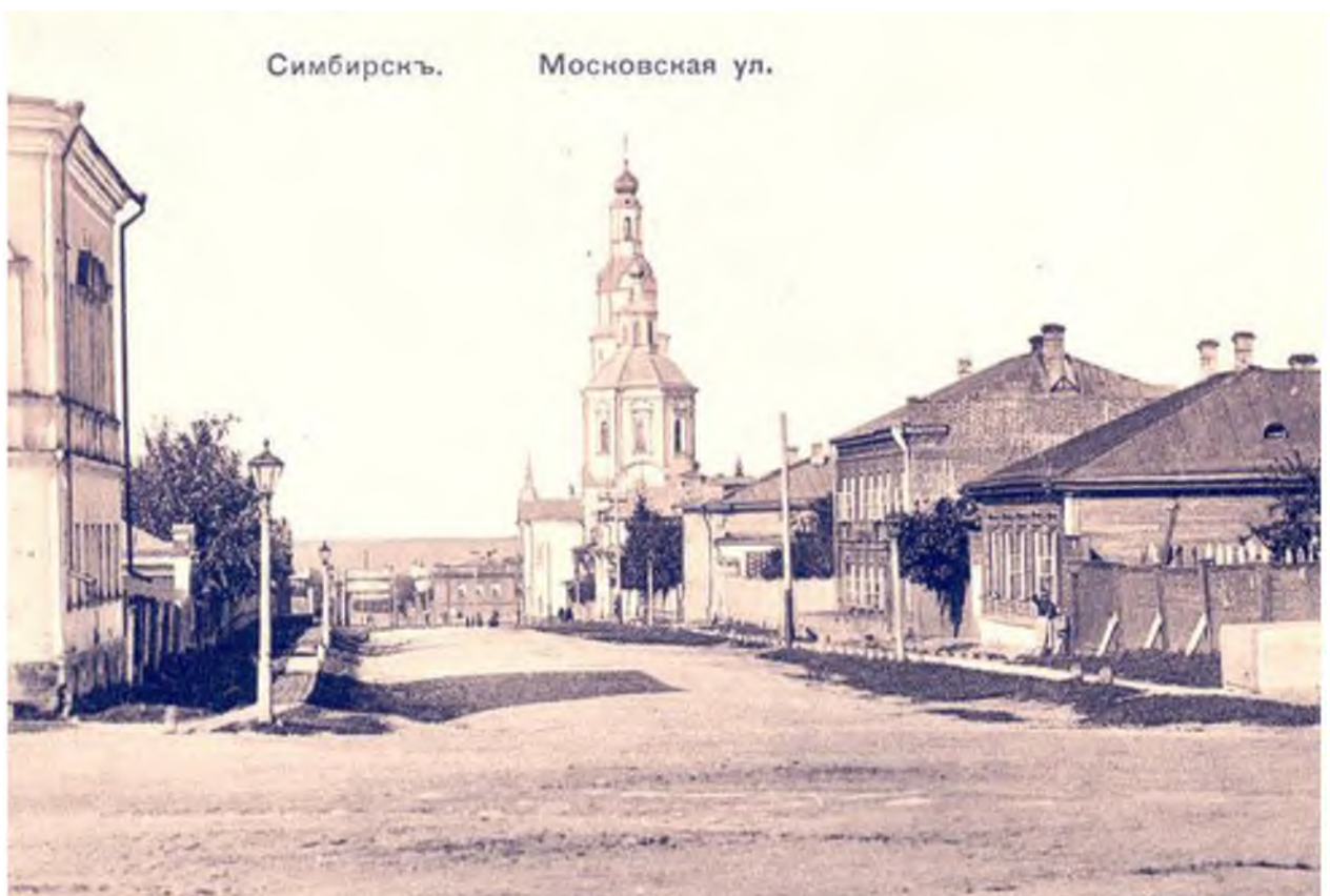
Копия открытки конца 19 века начала 20 века