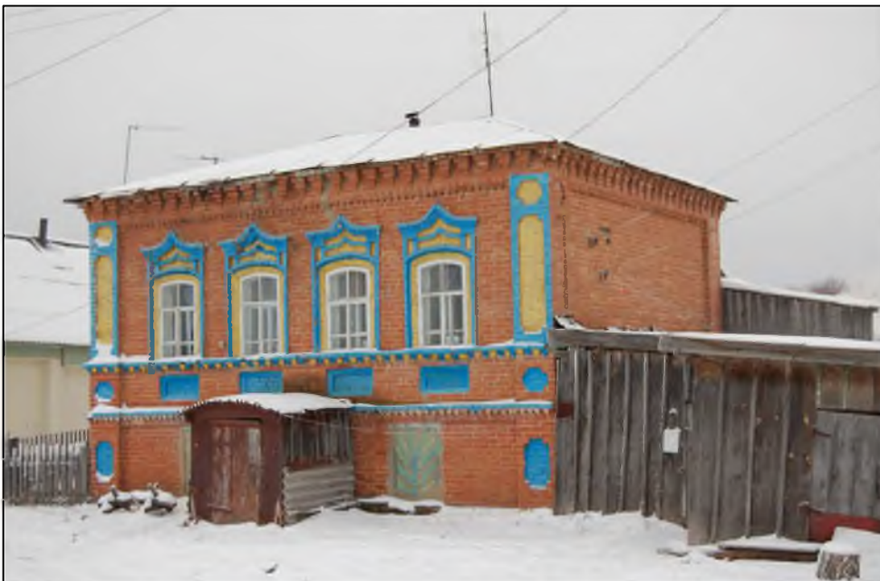
Ульяновская область, Карсунский район, ул. Центральная, 65. Вид на главный (восточный) и боковой (северный) фасады здания со стороны ул. Центральной. Современное фото.