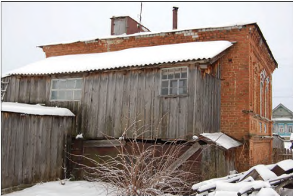
Ульяновская область, Карсунский район, ул. Центральная, 65. Вид на дворовый (западный) фасад с тамбуром входа со стороны дворовой территории. Современное фото.