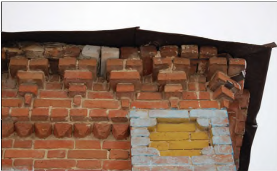
Ульяновская область, Карсунский район, ул. Центральная, 65. Фрагмент венчающего карниза, фриза и угловой лопатки с фигурной нишей. Современное фото.