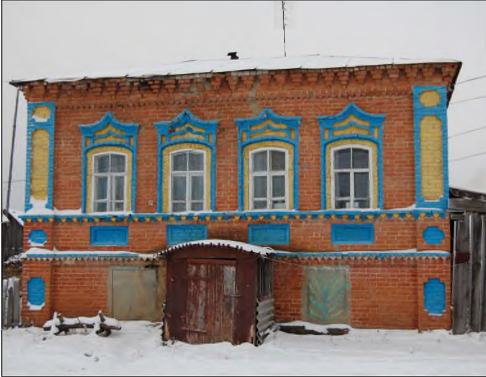
Ульяновская область, Карсунский район, ул. Центральная, 65. Вид на главный (восточный) фасад здания со стороны ул. Центральной. Современное фото.