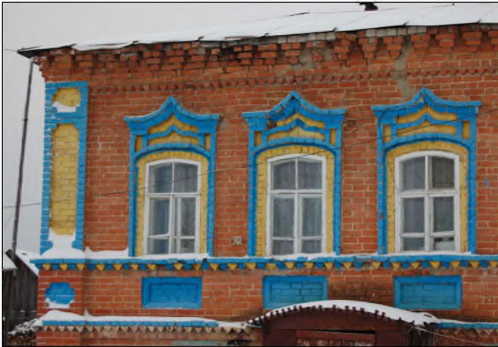
Ульяновская область, Карсунский район, ул. Центральная, 65. Декоративное оформление оконных проёмов и главного (восточного) фасада здания. Современное фото.