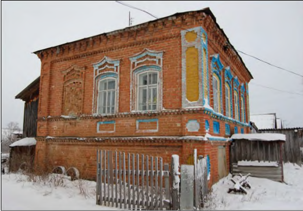
Ульяновская область, Карсунский район, ул. Центральная, 65. Вид на боковой (южный) фасад здания со стороны ул. Центральной. Современное фото.