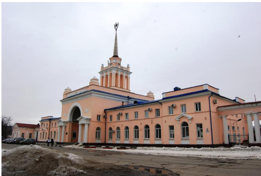
Общий вид на объект