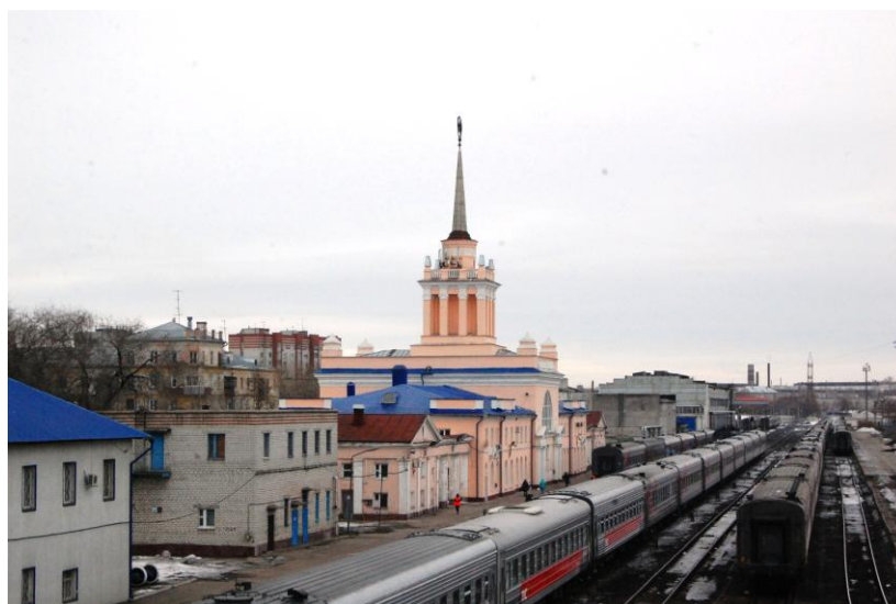
Вид с железнодорожных путей